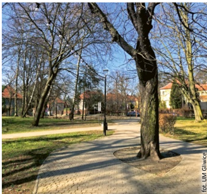
fol. UM Gliwice

Przypomnijmy, że pawilon w parku na placu Grunwaldzkim ma być obiektem na planie ośmiokąta o powierzchni około 270 m 2 , z elewacją z elementami transparentnymi, co pozwoli neutralnie wpisać się w uwarunkowania krajobrazowe i przyrodnicze. Na parterze przewidziano salę konsumpcyjną z barem, z rozsuwanymi przeszkleniami otwierającymi wnętrze na zielony krajobraz. Zaprojektowano również zadane podcienia ze stolikami, które w sezonie letnim stanowią będą naturalne przedłużenie sali konsumpcyjnej. Toalety, podobnie jak cała część parterowa, zostaną dostosowane do potrzeb osób z niepełnosprawnościami i pozbawione barier architekto-