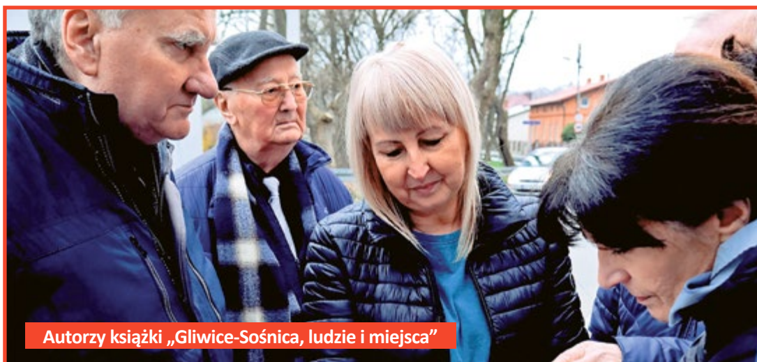
Autorzy książki „Gliwice-Sośnica, ludzie i miejsca”

Film prezentujący nagrodzonych można obejrzeć na youtube.com (dostępna jest także wersja z audiodeskcrypcją i transkrypcją). (KSP/bb)