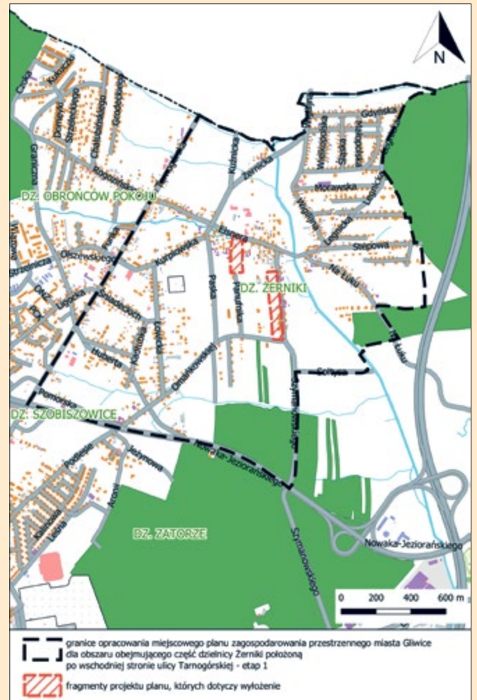
granice opracowania miejscowego planu zagospodarowania przestrzennego miasta Gliwice dla obszaru obejmującego część dzielnicy Żerniki położoną po wschodniej stronie ulicy Tarnogórskiej - etap I fragmenty projektu planu, których dotyczy wyłożenie

Załącznik graficzny do uwagi można przygotować w Geoportalu planistycznym pod adresem: ( https://msip.gliwice.eu/geoportale/Geoportal-planistyczny ) za pomocą narzędzia Dokumenty planistyczne/Zgłaszanie wniosków (ikona kartki papieru). Uwagi mogą również dotyczyć prognozy oddziaływania na środowisko. Termin składania uwag upływa 10 maja 2024 r. Uwagi złożone po upływie wyżej podanego terminu pozostaną bez rozpatrzenia. Organem właściwym do rozpatrzenia uwag jest Prezydent Miasta Gliwice, a w przypadku uwag nieuwzględnionych przez Prezydenta Miasta – Rada Miasta.