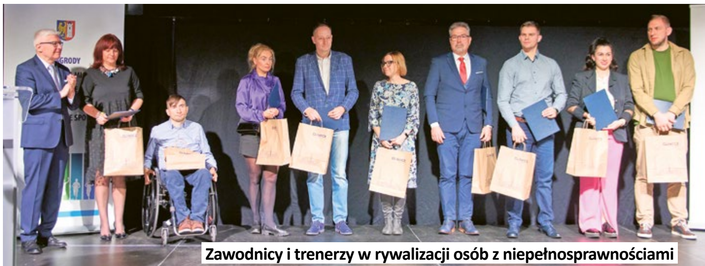
Zawodnicy i trenerzy w rywalizacji osób z niepełnosprawnościami

Wręczenie nagród i wyróżnień odbyło się w niedzielę, 24 marca, podczas Gali Sportu 2024 w Pre-Zero Arenie Gliwice.