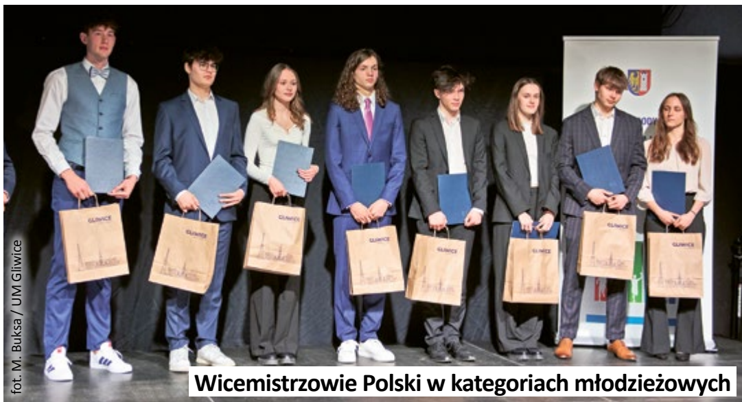
Wicemistrzowie Polski w kategoriach młodzieżowych

medalistów Mistrzostw Europy. Uhonorowani zawodnicy wywalczyli łącznie ponad 190 medali Mistrzostw Polski w różnych kategoriach wiekowych, a 41 z nich stawało na najwyższym stopniu podium, zdobywając tytuł Mistrza Polski.