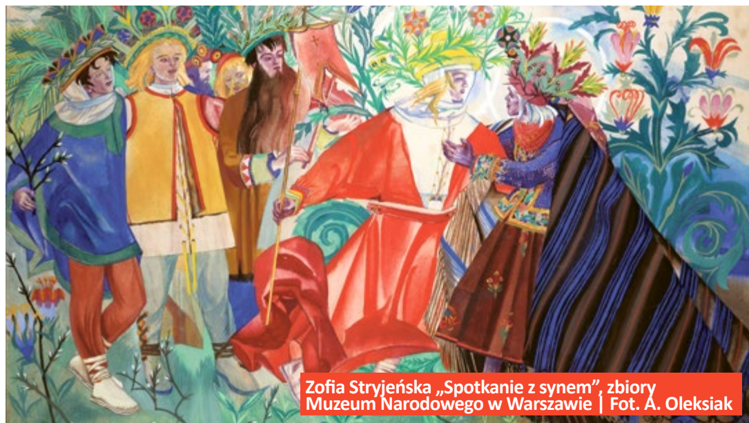
Zofia Stryjeńska „Spotkanie z synem”, zbiory Muzeum Narodowego w Warszawie

Od 30 marca do 1 kwietnia Muzeum w Gliwicach będzie nieczynne. (bb)