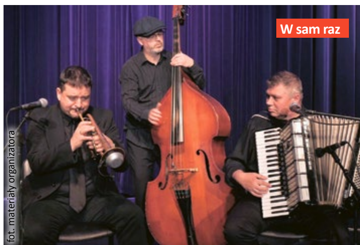
W sam raz

Gliwickie Spotkania Folkowe rozpoczną się o godz. 16.00. Bilety można kupić online – na ckv.systembiletowy.pl , stacjonarnie – w kasie Kina Amok (ul. Dolnych Wałów 3) oraz w Centrum Informacji Kulturalnej i Turystycznej (ul. Składowej 8a). Więcej informacji na ckvictoria.pl i w aplikacji [GAMA]. (CKV/bb)