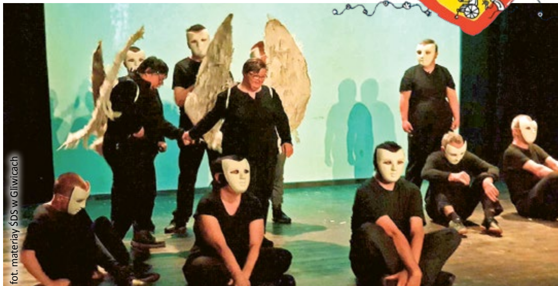
fol. materiały ŚDS w Gliwicach