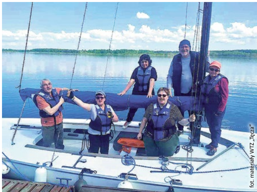
fol. materiały WTZ „Tęcza”