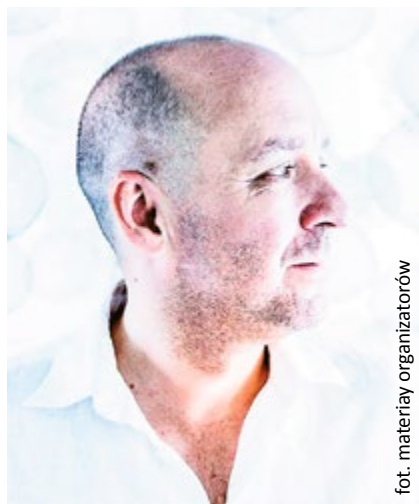
elektronicznych struktur dźwiękowych i instrumentów perkusyjnych. Gitarzy-

Jedną z ostatnich płyt Napiórkowskiego – „Hipokamp” – to album łączący wyrafinowane improwizacje jazzowe ze światem