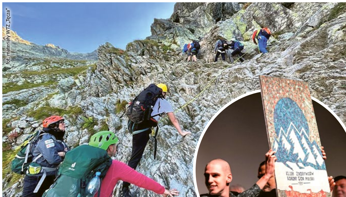
fol. materiały WZ „Tęcza”

W budynku przy ul. Fiołkowej 24 w Łąbędach, który „Tęczy” przekazało i współfinansowało remonto miasto, w barwnych pracowniach wypełnionych strojami, instrumentami muzycznymi, materiałami, koralikami, ceramiką, wstążkami i wyjątkową atmosferą 55 osób szykuje się do podwieczorku. Dziś będą jabłka i kawa.