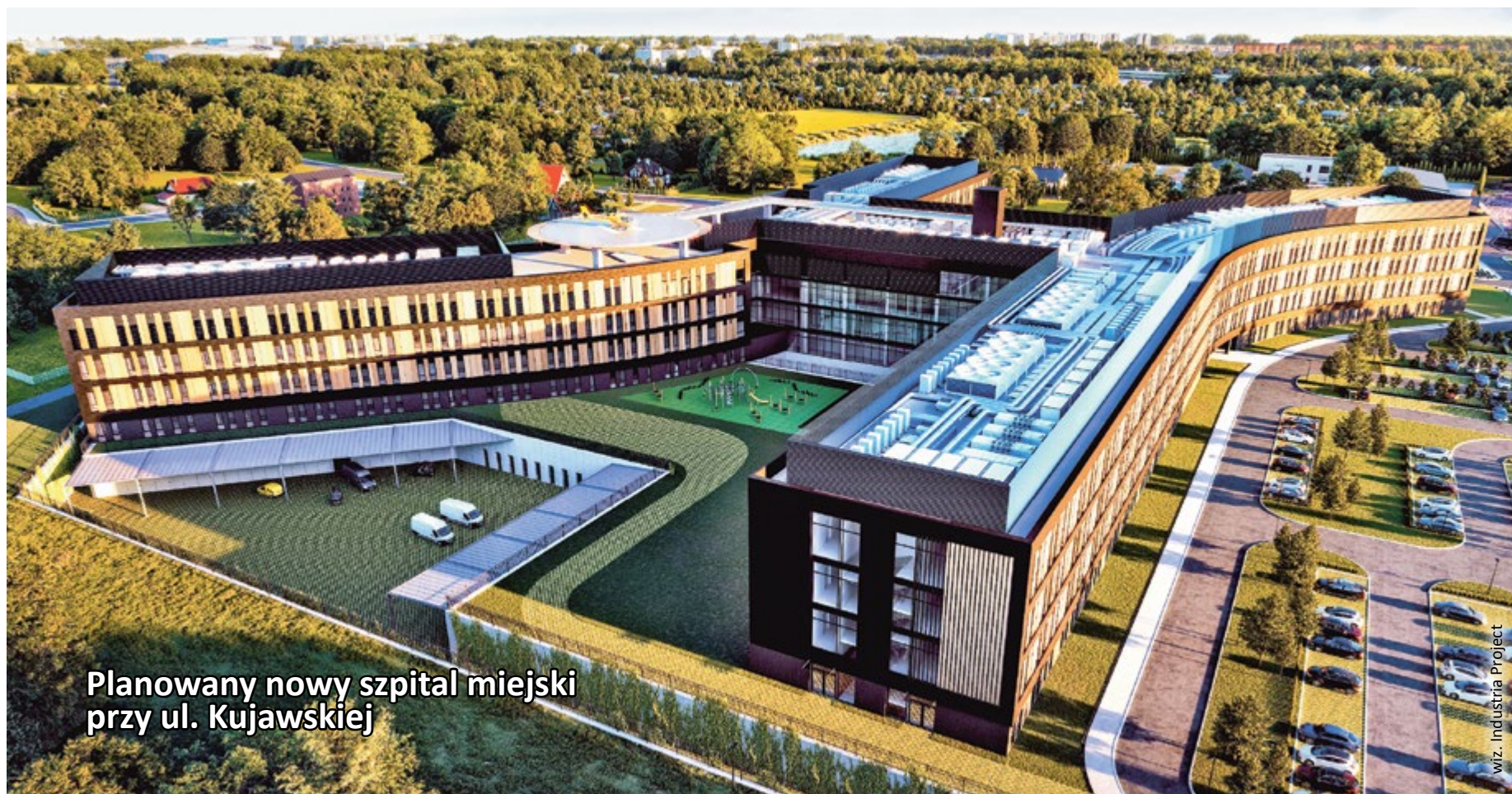
Planowany nowy szpital miejski przy ul. Kujawskiej