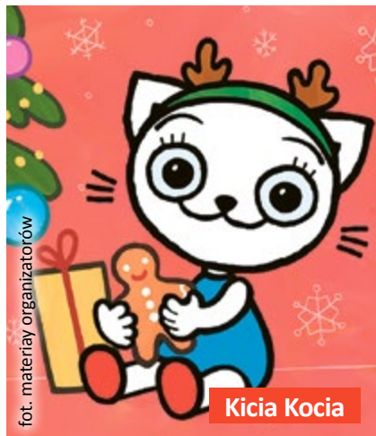
Seanse poprzedzi powitanie dzieci przez Świętego Mikołaja. Dla zainteresowanych rodziców jest również opcja spotka-

O godz. 16.15 na wielkim ekranie wyświetlona zostanie „Kicia Kocia pod choinkę”. Tytułowa bohaterka oraz jej przyjaciele – Pacek, Adelfka i Julianek – powrócą w zimowym wydaniu. Animowana, uwielbiana przez najmłodszych widzów seria powstała na podstawie książek Anity Głowińskiej. Ale to nie koniec wrażeń, bo o godz. 18.00 będzie można zobaczyć animację „Pies i Robot” – opowieść o potrzebie przyjaźni i bliskości. Film przeznaczony jest dla widzów powyżej 7. roku życia.