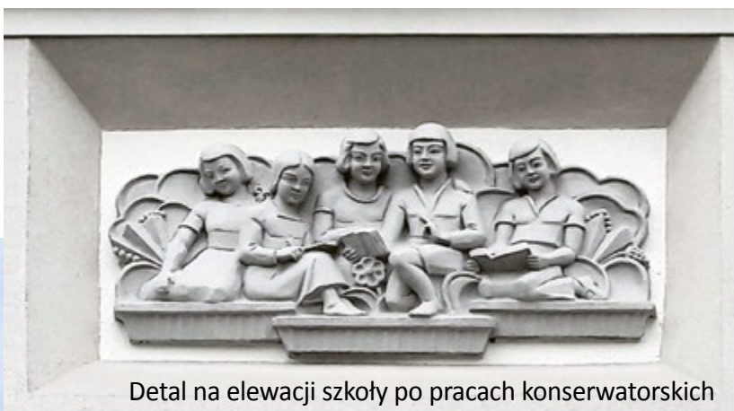
Detal na elewacji szkoły po pracach konserwatorskich