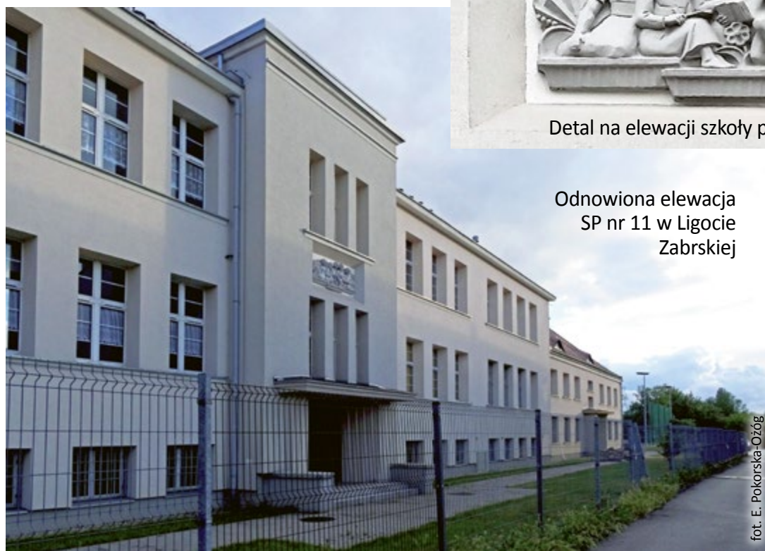
Odnowiona elewacja SP nr 11 w Ligocie Zabrskiej