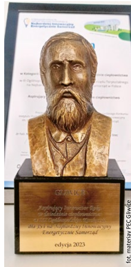
fol. materiały PEC Gliwice