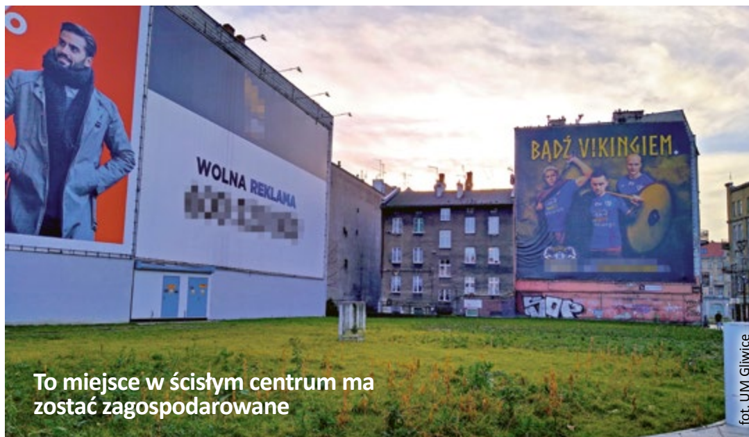
To miejsce w ścisłym centrum ma zostać zagospodarowane

Nadszedł dobry moment na takie zmiany i podejmowanie decyzji o przyszłości pustej działki. Niedawno zakończyła się ogromna miejska inwestycja, która zdecydowanie odmieniła jej otoczenie. Gruntownie przebudowany został układ drogowy po południowej stronie dworca kolejowego – wraz z placem dworcowym, ul. Bohaterów Getta Warszawskiego i fragmentem ul. Zwycięstwa. Zmienia