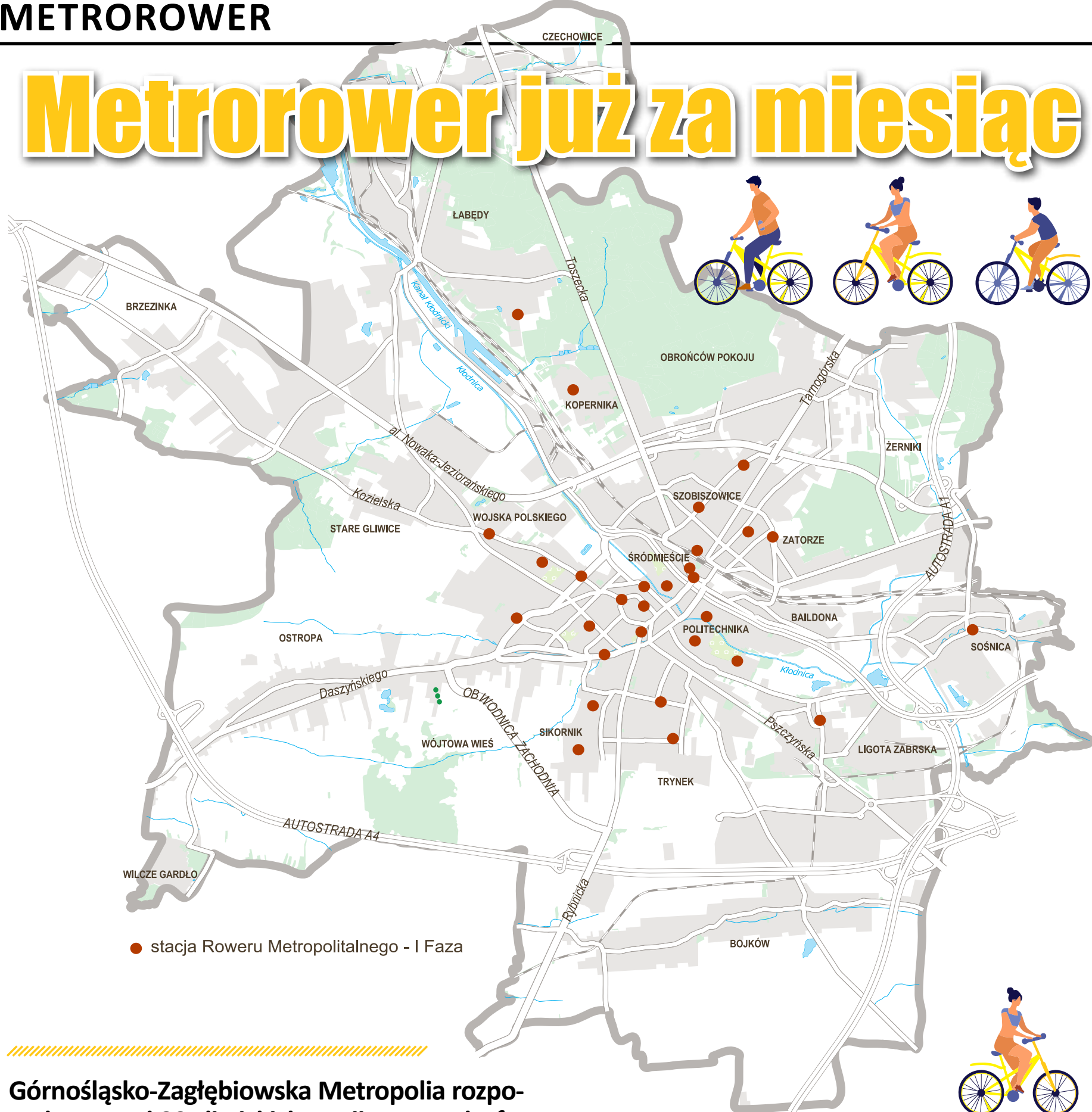
● stacja Roweru Metropolitalnego - I Faza

Górnośląsko-Zagłębiowska Metropolia rozpoczęła montaż 29 gliwickich stacji w ramach I fazy systemu Roweru Metropolitalnego. Do dyspozycji gliwiczian na tym etapie przewidziano 175 jednośladów. System ma zostać udostępniony 25 lutego.