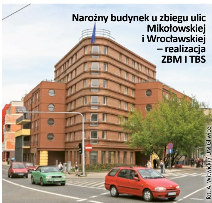
Narożny budynek u zbiegu ulic Mikołowskiej i Wrocławskiej – realizacja ZBM I TBS