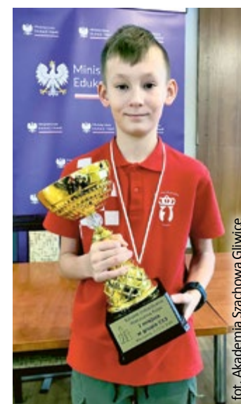
fot. Akademia Szachowa Gliwice

Trzynastolatek mieszka w Gliwicach, gdzie obecnie uczy się w ZSO nr 8. Od najmłodszych lat wykazywał talent do gry w szachy, więc już jako 6-latek wstąpił w szeregi Akademii jako zawodnik, by kontynuować treningi pod okiem doświadczonych instruktorów. (Akademia Szachowa Gliwice/ad)