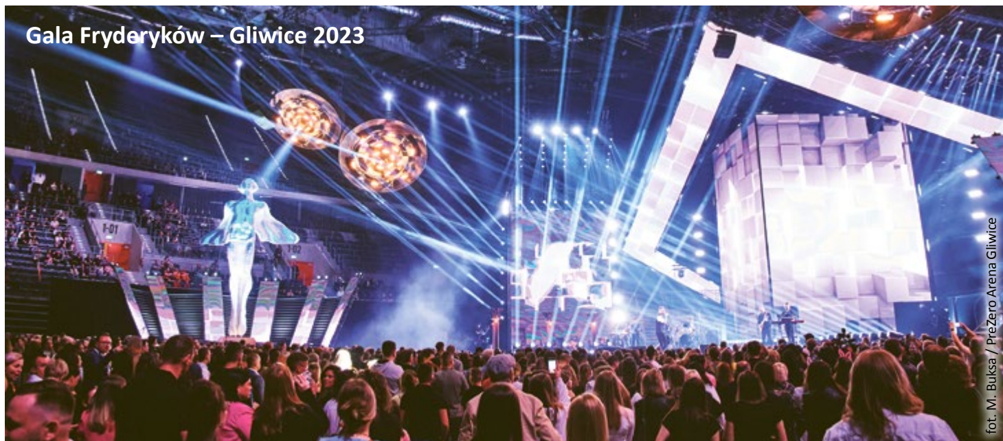
Gala Fryderyków – Gliwice 2023

Ceremonię rozdania Fryderyków zaplanowano na 22 marca . Wcześniej Związek Producentów Audio Video ogłosił nominacje do nagród w 27 kategoriach muzyki rozrywkowej i jazzu oraz 10 kategoriach muzyki poważnej. Wówczas sukcesywnie będziemy poznawać kolejnych artystów, którzy wystąpią podczas koncertów finałowych 30. Gali Muzyki Rozrywkowej i Jazzu. Na ten moment orga-