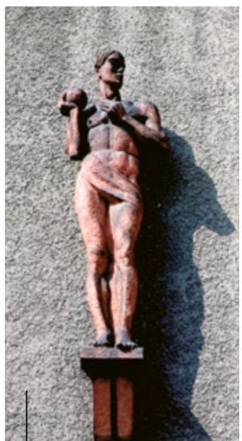
Figurki młodzieńców przed pracami konserwatorskimi z fasady Wydziału Elektrycznego Politechniki Śl.

Jednak najbardziej spektakularną dekoracją jest przywołany w tytule rydwan. Przedstawia go płaskorzeźba umieszczona na ścianie paradyjnej bramy – wejścia do kamienicy przy ul. ks. Stanisława Chudoby 6.