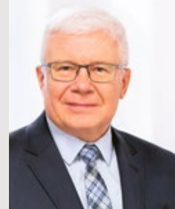
Adam Neumann prezydent Gliwic

– Naszym priorytetem jest zapewnienie dzieciom i młodzieży komfortowych warunków do nauki i zabawy, dlatego w Gliwicach nieustannie modernizujemy infrastrukturę oświatową wraz z jej otoczeniem – boiskami sportowymi czy placami zabaw. Szkoła Podstawowa z Oddziałami Integracyjnymi nr 3 im. Arki Bożka w Ostropie to jedna z kilku gliwickich placówek, które zostaną rozbudowane. Zmiany czekają także Zespół Szkolno-Przedszkolny nr 7 w Wójtowej Wsi czy w niedalekiej przyszłości Szkołę Podstawową nr 29 przy ul. Staromiejskiej. Na finiszu są także prace związane z budową nowego przedszkola w Żernikach.