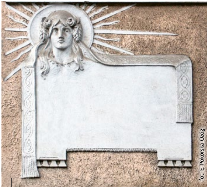
Detal na elewacji secesyjnej kamienicy przy ul. Krzywej 16

W Gliwicach na elewacji budynku Starostwa przy ul. Królowej Bony zamiast mitycznego Atlasa mamy... gnomy podtrzymujące belkowanie i niosące worki pełne pieniędzy (na zdjęciu powyżej). Sylwetki zakłęte w rzeźby widać też na elewacji Wydziału Elektrycznego Politechniki Śląskiej (dawny Konwikt Albertinum w dzielnicy akademickiej). Umieszczono tam dwie figury młodzieńców, a może były to