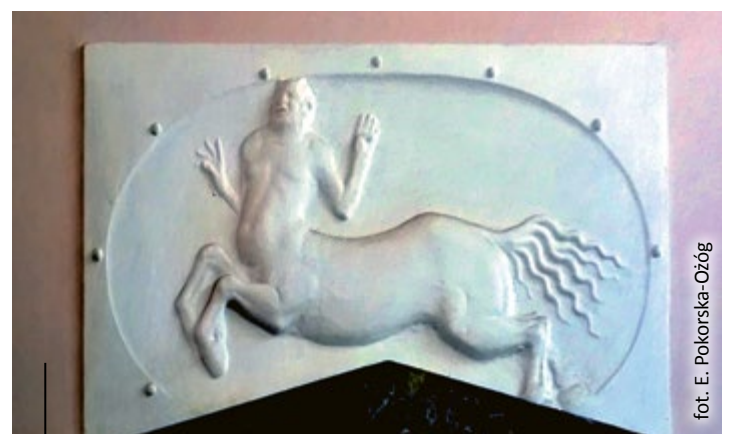
Centaur z gliwickiej kamienicy przy ul. Zwycięstwa 53