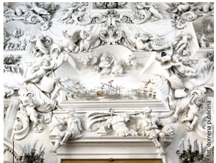
Sycylijskie przedstawienia z puttami autorstwa Giacomo Serpotty

Wiem, że mieszkańcy kamienicy z ul. Chudoby planują remont tego niecodziennego detalu. Jednak póki co pilniejsze było wyremontowanie m.in. elewacji i dachu. Czy w innym mieście możemy spotkać przedstawienie tego tematu? Tak – w Katowicach, gdzie płaskorzeźba z kwadrygą dekoruje elewację kina Rialto. Jeżeli jednak już poruszamy temat starożytnych pojazdów, to nie sposób nie wspomnieć o filmie Hugh Hudsona „Rydwany ognia” z 1981 roku z zapadającą w pamięć muzyką Vangelisa. Powstał na kanwie prawdziwej historii dwóch biegaczy, którzy wzięli udział w letnich igrzyskach olimpijskich w 1924 roku. A skąd pomysł na tytuł? To fragment wiersza Williama Blake’a „Jeruzalem”: