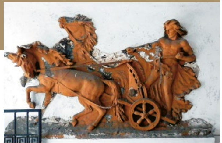
Płaskorzeźba z rydwanem z kamienicy przy ul. Stanisława Chudoby 6

Gliwicki rydwan i jego woznica są przedstawieni w sposób bardzo dynamiczny, wręcz ekspresyjny. Artysta-sztukator, wykonujący to dzieło, zadbał o każdy, najdrobniejszy szczegół. Wysięk, jaki maluje się na twarzy powożącego pojazd mężczyzny i pędzące konie z rozwianymi grzywami sprawiają wrażenie, że biga (inna nazwa rydwanu) wyskoczy na nas ze ściany.