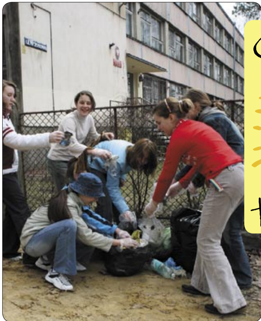
Porządkowano m.in. teren wokół siedziby SP nr 32 przy ul. Wrzosowej