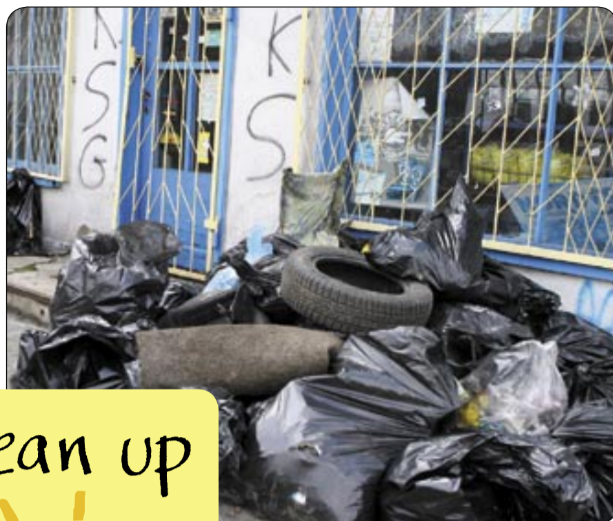
Plon akcji - ul. Przyszowska