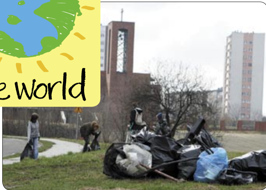
Na polach w rejonie Sikornika natrafiono na stare żelastwo