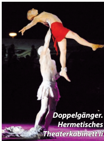
Doppelgänger. Hermetisches Theaterkabinett II