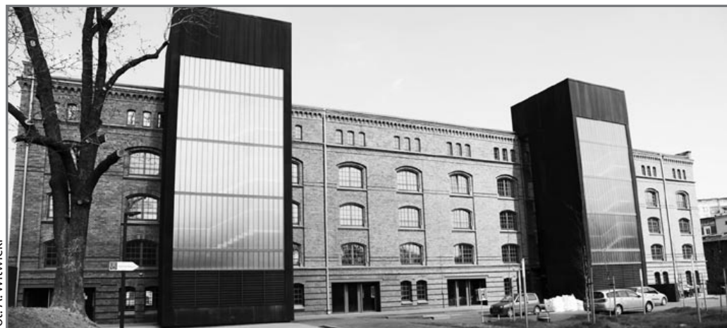
fol. A. Włotwicki

Konkurs na Superjednostkę Roku został przeprowadzony po raz pierwszy. Ma promować dobre wzorce architektoniczne i urbanistyczne w województwie śląskim. Stanowi przeciwieństwo Betonowej Kostki – antynagrody przyznawanej od czterech lat dla nieudolnych modernizacji i nietrafionych założeń urbanistycznych. Propagatorem i autorem obydwu akcji jest stowarzyszenie Moje Miasto. (łaza)