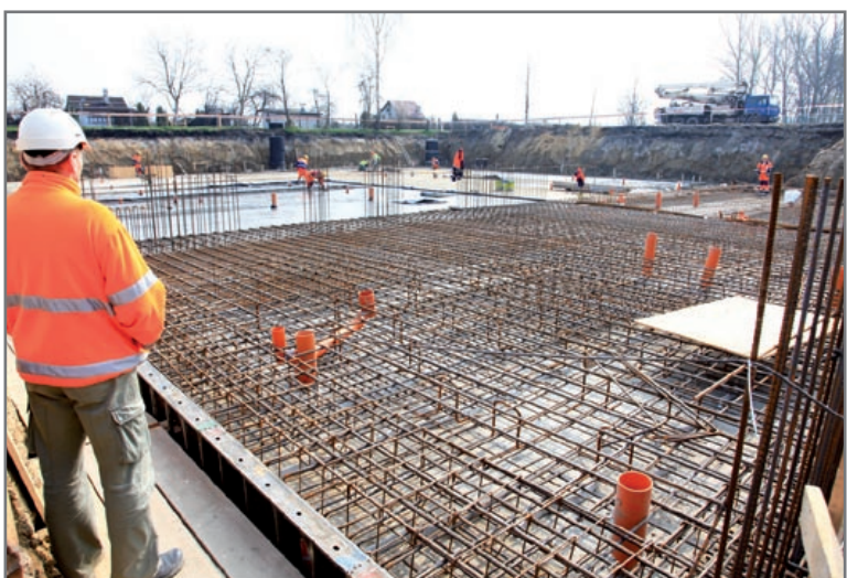
– Zadanie zrealizujemy w terminie, a nawet szybciej – przekonują wykonawcy