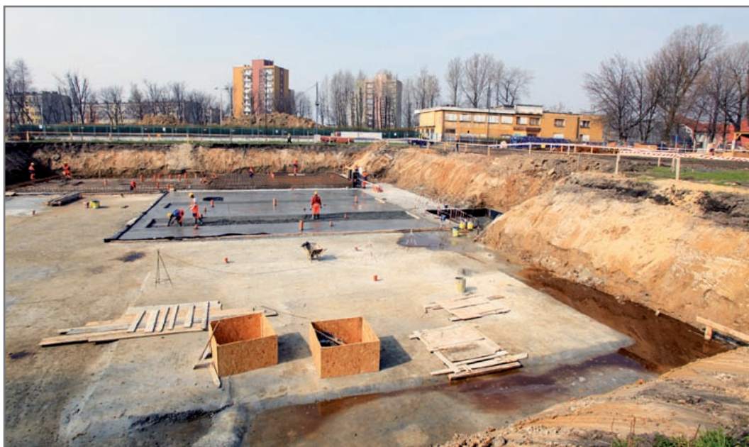
Przy Dzionkarzy praca wre – w wielkim wykopie wybetonowano już podłoże

Koszt budowy krytego basenu wyniesie ponad 15 mln złotych. Pieniądze na ten cel zostaną wyasygnowane z miejskiego budżetu. – Kryta pływalnia w Sośnicy będzie już czwartym tego typu obiektem w Gliwicach wybudowanym przez samorząd. Każdy z nich znajduje się w innej dzielnicy, tak aby zapewnić dogodny dostęp do nich jak największej liczbie mieszkańców. To sytuacja dość wyjątkowa, nie tylko na Śląsku, aby ponad 180-tysięczne miasto dysponowało taką liczbą ogólnodostępnych miejskich akwenów pływackich. To, że możemy sobie pozwolić na takie przedsięwzięcia, jest efektem naszej gospodarności. Dochody miasta wzrosły na tyle, że możemy – bez zaciągania kredytów – budować między innymi takie obiekty – podkreślił Zygmunt Frankiewicz. (bom)