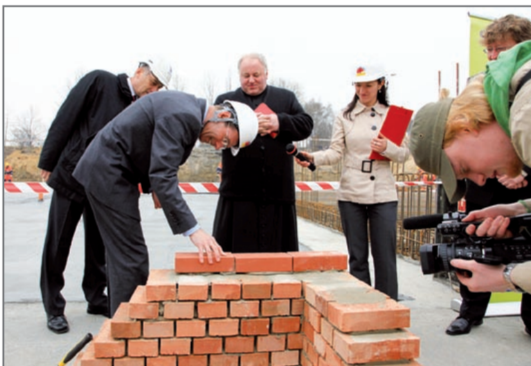
Prezydent Gliwic wmurowuje kamień węgielny pod nowy basen