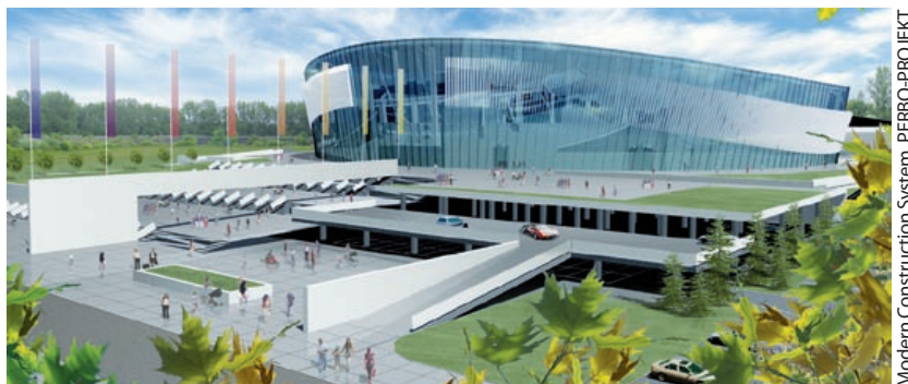
Modern Construction System, PERBO-PROJEKT

Trwają przygotowania do budowy hali widowiskowo-sportowej PODIUM. 20 kwietnia w gliwickim Urzędzie Miejskim została podpisana umowa z inżynierem kontraktu. Wyłonione w przetargu konsorcjum firm GRONTMIJ Polska i GRONTMIJ Nederland zajmie się m.in. przygotowaniem dokumentacji niezbędnej przy wyborze firmy, która zbuduje obiekt. Wykonawcę tego zadania możemy poznać jeszcze w tym roku.