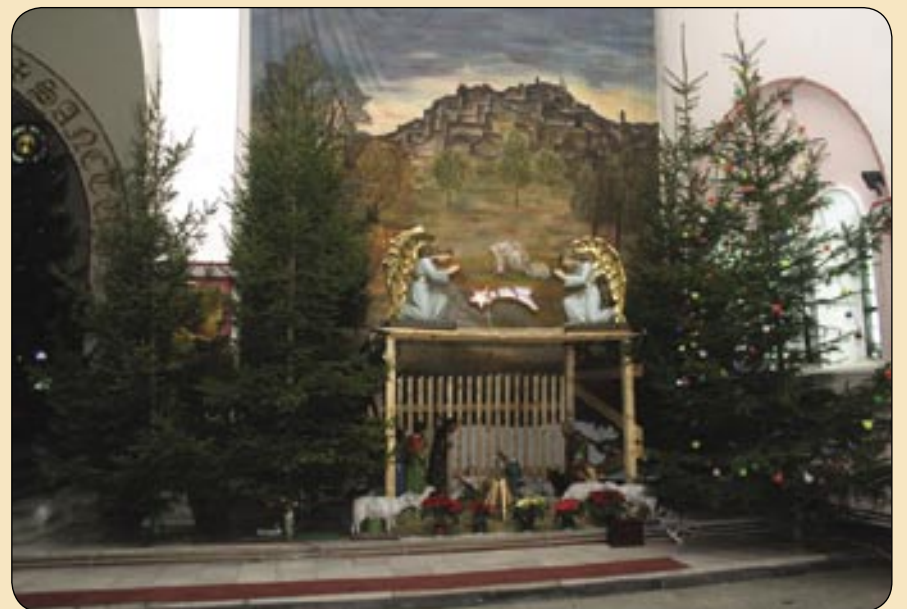
Kościół św. Antoniego