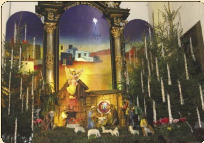
Kościół Wszystkich Świętych