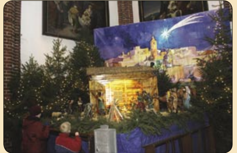
Kościół św. Bartłomieja