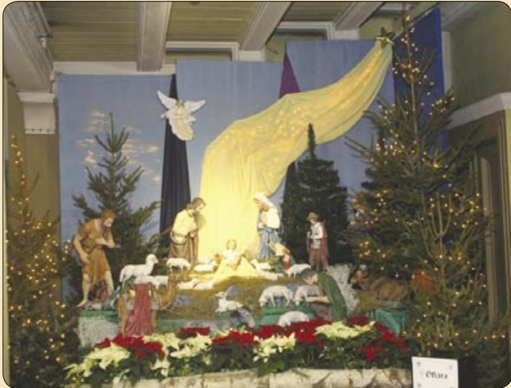
Kościół garnizonowy św. Barbary