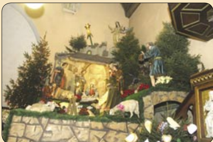
Kościół Podwyższenia Krzyża Świętego