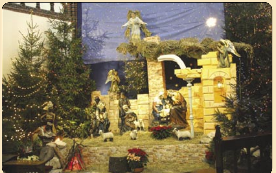
Kościół Katedralny św. Apostołów Piotra i Pawła