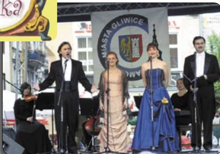
Soliści Gliwickiego Teatru Muzycznego przypomnieli m.in. popularne arie operetkowe