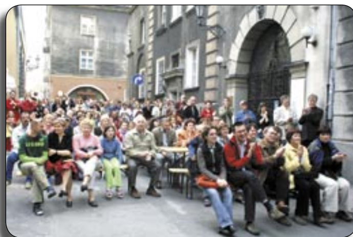
Koncertы na ul. Krótkiej miały duże wzięcie u publiczności