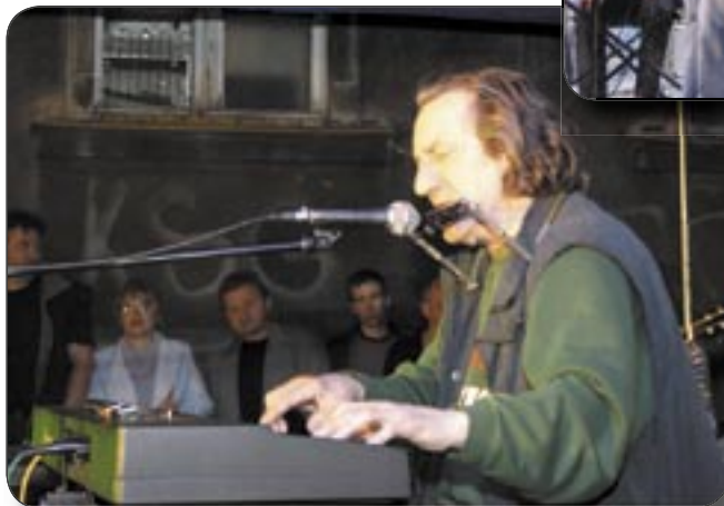
Jan „Kyks” Skrzek w bluesowym repertuarze