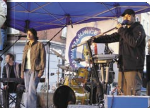
Grupa „NEW DAY” była gwiazdą wieczoru „Cantate Deo”, poświęconego piosenke religijnej