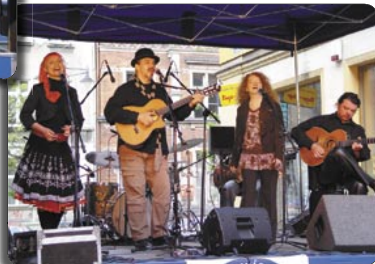
„CZERWONY TULIPAN” przedstawił oryginalne utwory w konwencji poezji śpiewanej