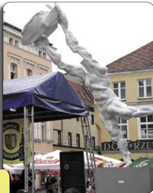
Estrada na Rynku sąsiadowała z niecodzienną rzeźbą