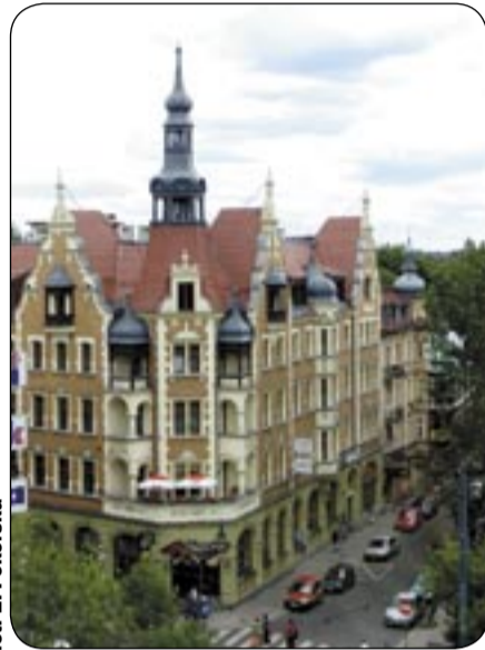
Jeden z obiektów wpisanych do rejestru

Dlatego nie powinno dziwić, że właściciele zabytków poszukują w różnych instytucjach pieniędzy na ich niezbędne, acz kosztowne remonty. Poszukiwania te niejednokrotnie są źle prowadzone. Nie wszyscy wiedzą o tym, że ewentualna pomoc finansowa może być udzielona wyłącznie na renowację obiektów wpisanych do rejestru zabytków. Jeśli zaś obiekt