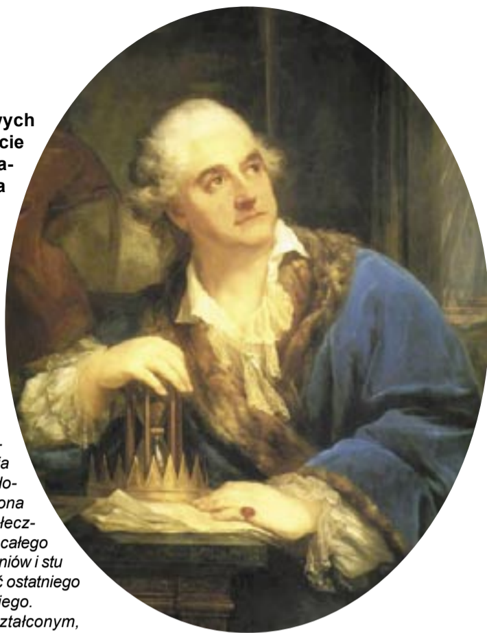
Portret Stanisława Augusta Poniatowskiego z klepsydrami (1793) - Marcello Bacciarelli, Muzeum Narodowe w Warszawie

Fundował uczelnię, ale biednej młodzieży stypendia, otoczył opieką artystów, malarzy, architektów, osobiście patronował rozwojowi nauk historycznych, położył wielkie zasługi w dziedzinie archiwistyki, organizował sławne „obiady czwartkowe”, które stanowiły niezwykle inspirującą formę mecenatu królewskiego w dziedzinie literatury, był bibliofilem, inspirował rozwój czasopiśmiennictwa, wspierał rozwój drukiarstwa, doprowadził do powstania teatru narodowego, utworzył mennicę państwową, wspierał roz-