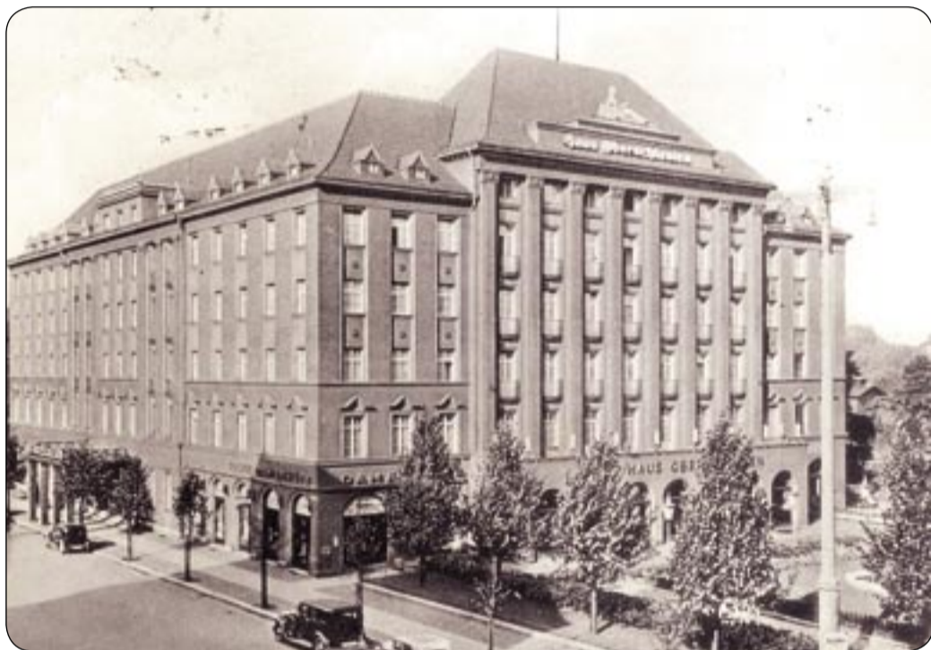
Jednym z obiektów prezentowanych w filmie był dawny hotel HAUS OBERSCHLESIEN (obecnie budynek Urzędu Miejskiego)

Architektoniczny funkcjonalizm - jak pisałam w jednym ze wcześniejszych odcinków cyklu „Śladami historii” - powstał jako antidotum na bogactwo eklektycznych i secesyjnych dekoracji. Odrzucając detale architektoniczne postawiono na piedestał estetykę surowości. Obiekty, które powstały we wczesnym okresie funkcjonalizmu, można było określić uproszczonym historyzmem. Stosowano wówczas ascetyczne detale kubiczne. Następne realizacje odpowiadały już wymogowi: „mniej znaczy więcej”, co było równoznaczne z rezygnacją z jakichkolwiek dekoracji. Nie nale-