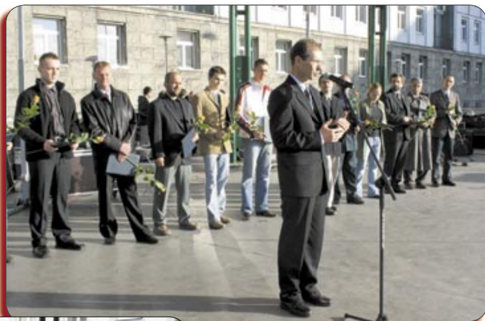
Na Placu Krakowskim prezydent Gliwic wręczył nagrody za ubiegłoroczne osiągnięcia w dziedzinie sportu

Gliwice przystąpiły do współzawodnictwa w grupie miast o liczbie mieszkańców powyżej 100 tysięcy. Naszymi rywalami byli: Bielsko-Biała, Częstochowa, Dąbrowa Górnicza, Katowice, Ruda Śląska, Sosnowiec i Tychy. Warunek klasyfikacji stanowił udział mieszkańców w różnych formach rekreacji fizycznej. Imprezy sportowe dla gliwiczian przygotowały 1 czerwca przedszkola, szkoły, Politechnika Śląska, stowarzyszenia sportowe i rekreacyjne, kluby taneczne i fitness, ośrodki sportu, rady osiedlowe i inne instytucje. Wielki finał odbył się na Placu Krakowskim pod hasłem „Dzień Dziecka na Sportowo”. Pogoda sprawiła organizatorom i uczestnikom zabawy miłą niespodziankę. Słońce zaświeciło tuż przed rozpoczęciem imprezy ... (a!)