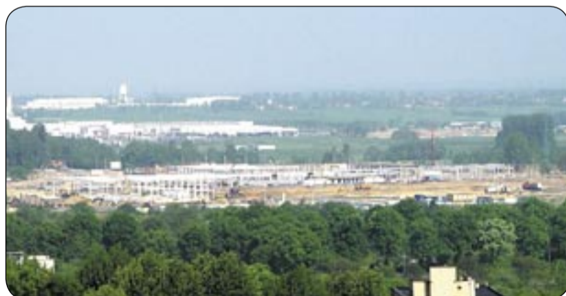
fol. K. Krzeminski

Najszybciej można zagłosować korzystając z internetowego linku zamieszczonego na głównej stronie UM ( www.um.gliwice.pl ). Propozycje z dopiskiem: „Nazwa centrum” można także przesyłać na adres e-mail: rzecznik@um.gliwice.pl . Czekamy do 9 czerwca 2006 r. Dla pomysłodawców 3 najlepszych propozycji nazw przewidziano nagrody. (ah)