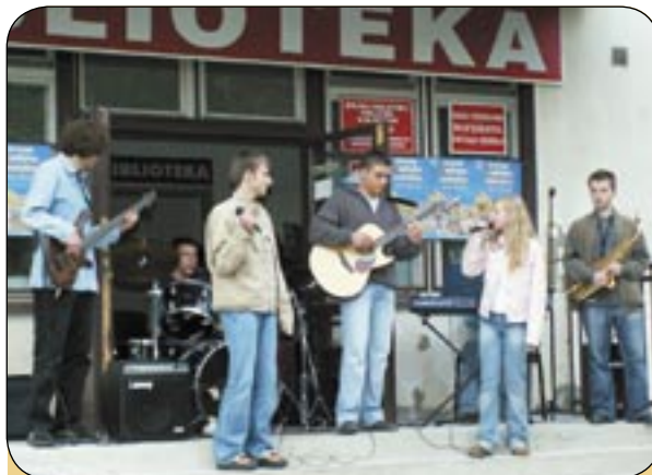
Pieczenie pączków i kielbasek, występy dzielnicowych zespołów muzycznych i teatralnych - to atrakcje majowej imprezy przygotowanej przez Radę Osiedla Kopernik. Organizatorzy informują, że do przygotowania podobnego spotkania udało się „po sąsiedzku” zachęcić niektórych mieszkańców Łabęd.