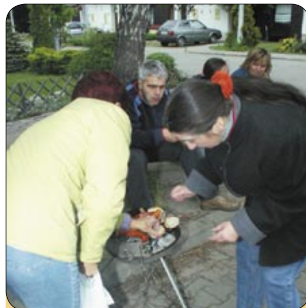
W Bojkowie Rada Osiedlowa zorganizowała nie tylko ognisko, ale także zabawy sportowe i konkurs wiedzy o dzielnicy.