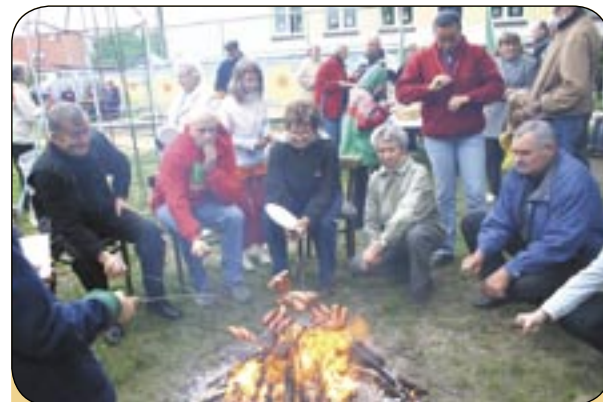
Wspólne biesiadowanie zaproponowane przez Radę Osiedla w Wilczym Gardle urozmaicił występ chóru „Melodia”. Na sąsiedzkie rozmowy nie zawsze jest czas - uczestnicy zwierzyli się, że właśnie tego popołudnia znajomość nawiązali lokatorzy dwóch sąsiednich domów, mieszkający obok siebie od kilku lat.