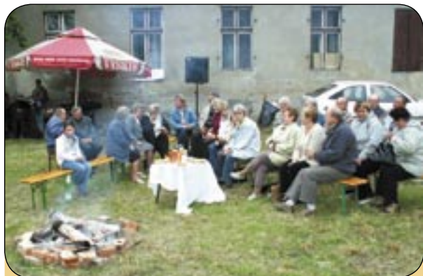
Rada Osiedlowa Czechowice zaprosiła mieszkańców dzielnicy m.in. na ognisko i zabawę taneczną.

Wszystko zaczęło się w 1999 roku, kiedy w Paryżu zorganizowano imprezę pod nazwą „Immeubles en fete”. Rok później „Dzień Sąsiada” obchodzono już w całej Francji. W 2003 roku inicjatywa zyskała zasięg międzynarodowy, bo pomysł spodobał się Belgom. Od 2004 roku „Europejskie Święto Sąsiadów” jest popularyzowane w krajach Unii Europejskiej. Rok temu obchodzono je w 450 miastach - w 16 krajach. Tym razem po raz pierwszy zaproszono do udziału miasta polskie. Europejskim koordynatorem obchodów pozostaje Stowarzyszenie „Immeubles en Fete” z siedzibą w Paryżu.