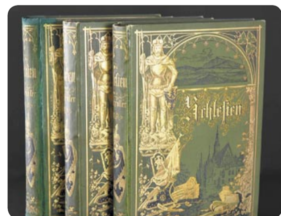
Dzieło Franza Schrollera pt. „Schlesien. Eine Schilderung des Schlesierlandes”