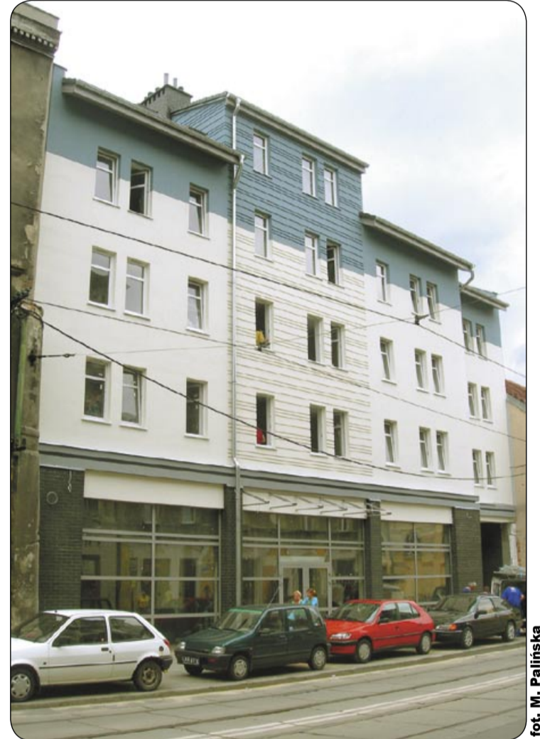
fol. M. Palinska

resowanych ofertą TBS. W trakcie zwiedzania warto zwrócić uwagę na wysoki standard lokali, z panelami na podłodze, wykafelkowaną kuchnię i łazienką. Wszystkie mieszkania wyposażono w kucharki gazowe, instalacje sanitarne oraz wanny lub prysznice. Wystarczy tylko wnieść meble i już można zamieszkać. Pomyślano