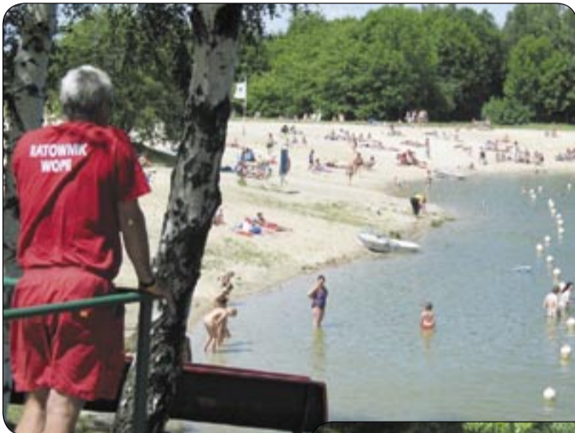
WOPR w akcji