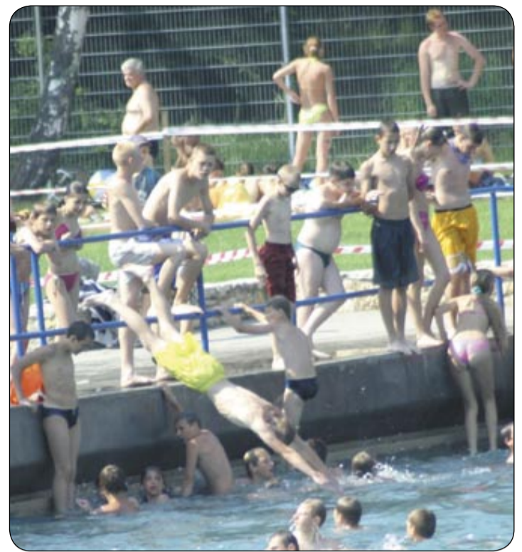
Ryzykanci skaczą do wody w miejscach niedozwolonych

- W tej grupie była m.in. matka Kacperka. Miała - jak sądzę - ok. 28 lat. Trzymała na ręku jeszcze mniejsze dziecko. Jej synek znajdował się już w karetce. Zajrzała do środka i poznała chłopczyka po kąpielówkach. Wtedy dopiero wybuchnęła płaczem i zaczęła lamentować. Gdy ją spytałem, dlaczego pozostawiła ma-