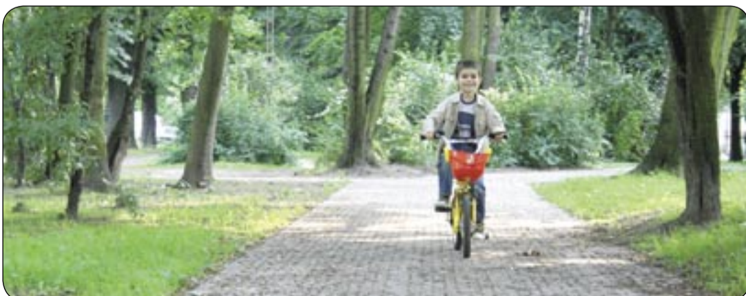
Odnowione alejki na Placu Grunwaldzkim sprzyjają rekreacji