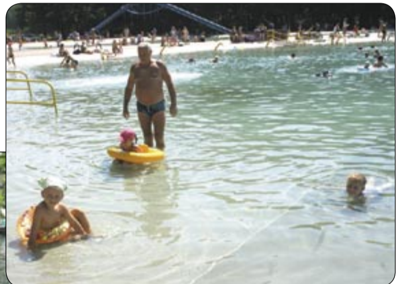
Dzieci w basenie nie mogą ani na chwilę być pozbawione opieki dorosłych

Kotulak. Nie potrafi on jednak zrozumieć takiej postawy życiowej. Od kilku tygodni sam jest szczęśliwym ojcem wspaniałej córeczki i nie może pojąć, jak można zlekceważyć opiekę nad małym dzieckiem. - To skandaliczna bez troska - ocenia.