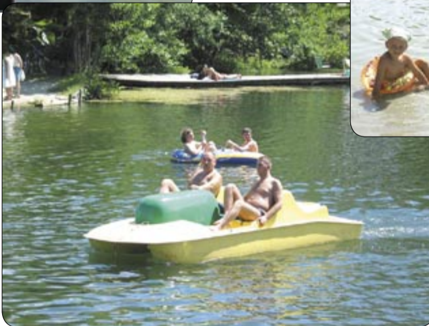
Sprzęt pływający nie powinien zagrażać bezpieczeństwu osób kąpiących się w jeziorze