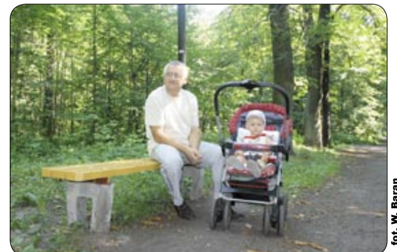
Trakty spacerowe w lesie komunalnym zyskują nową nawierzchnię