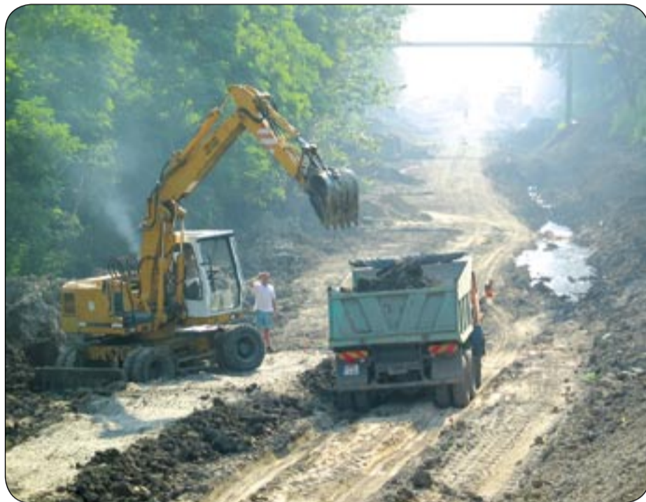
fol. A. Witwicki

Powstaje zupełnie nowa droga o długości 1,2 km z dwoma rondami. Roboty są już zaawansowane i powinny zakończyć się w połowie października bieżącego roku. To połączenie udrożni dojazd do południowej części gliwickiej podstrefy Katowickiej Specjalnej Strefy Ekonomicznej (zlokalizowanej w pobliżu ulicy Bojkowskiej). Ciężkie samochody transportowe, które tam docierają od strony autostrady A-4 i DK-44, nie będą musiały przemieszczać się ulicą Bojkowską.