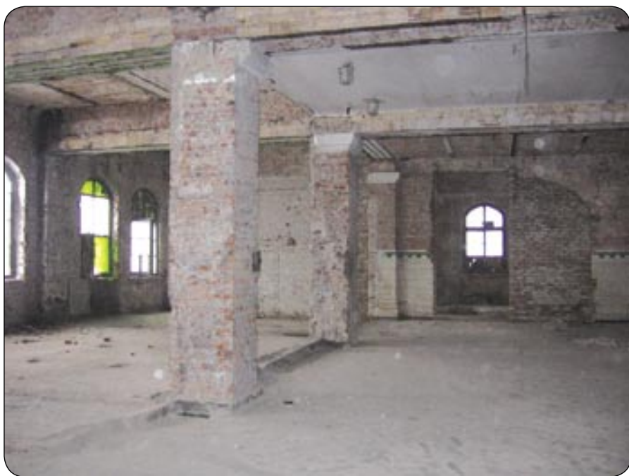
Zakończono wewnętrzne wyburzenia w zabytkowej cechowni

Funkcjonowanie firm w inkubatorze ma z założenia charakter przejściowy. Po kilku latach - zwykle jest to okres od 3 do 5 lat - przedsiębiorstwa powinny się „usamodzielić”. Kolejnym etapem rozwoju jest powiększenie firmy lub budowa własnej siedziby, a także zakładu produkcyjnego czy magazynów. W tym celu biznesmenom zostanie udostępniona trzecia strefa „Nowych Gliwic” - czyli ponad 10 ha uzbrojonych terenów inwestycyjnych. (a)