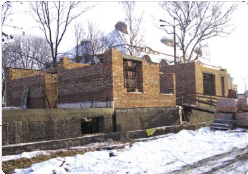
Wymurowano ściany parteru w budynku dydaktycznym GWSP

preferencyjnych warunkach. Pozwoli im to na bezpieczne rozpoczęcie działalności biznesowej i stworzenie nowych miejsc pracy. Dodatkowo będą mogli korzystać z usług doradczych, pomocy księgowego czy prawnika. ARL stara się także nawiązać współpracę z naukowcami z Politechniki Śląskiej, GWSP i innych regionalnych uczelni. - Chcielibyśmy, aby inkubowane przedsiębiorstwa kontaktowały się ze specjalistami różnych branż i otrzymywały