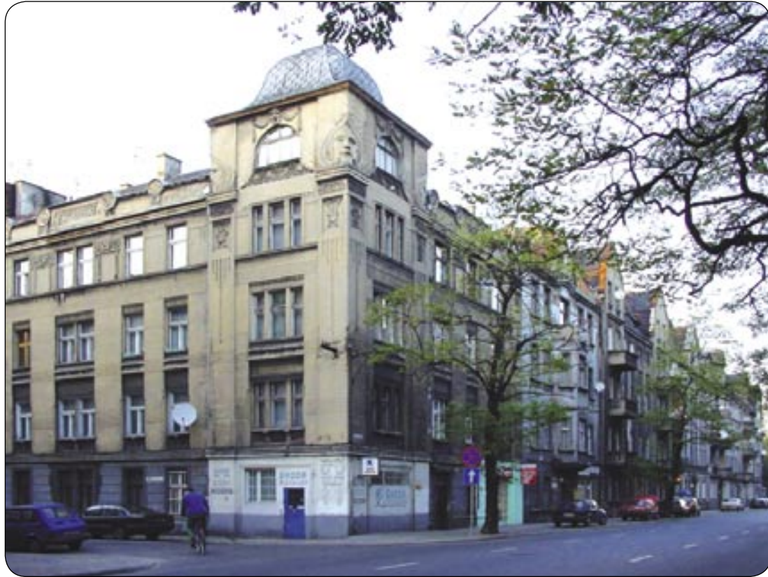
fol. E. Pokorska

Najbardziej znanym i najczęściej fotografowanym obiektem secesyjnym w Gliwicach jest kamienica przy ul. Częstochowskiej 15 (róg ul. Gorzołki). Przyczyną tej „popularności” jest m.in. - oprócz niewątpliwych walorów architektonicznych budynku - eksponowana, narażona lokalizacja kamienicy w centrum miasta. Wystający dwupiętrowy wykusz zwieńczony niską wieżyczką dodatkowo podkreśla to usytuowanie.