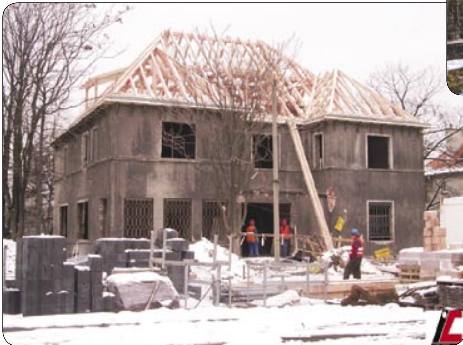
W willi byłego dyrektora wykonano drewnianą konstrukcję dachu

micznych w regionie. Studenci zostaną przygotowani do konkretnych działań w dziedzinie przedsiębiorczości. Absolwenci będą mogli od razu rozpocząć aktywność zawodową i stworzyć sobie własne miejsce pracy w inkubatorze przedsiębiorczości. W działających przy ulicy Bojkowskiej firmach będą mogli także odbywać praktyki.