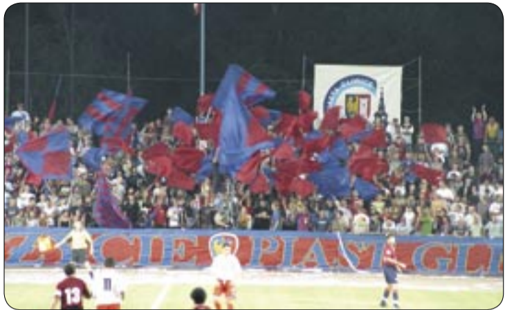
Mecz trwa, kibice dopingują zawodników