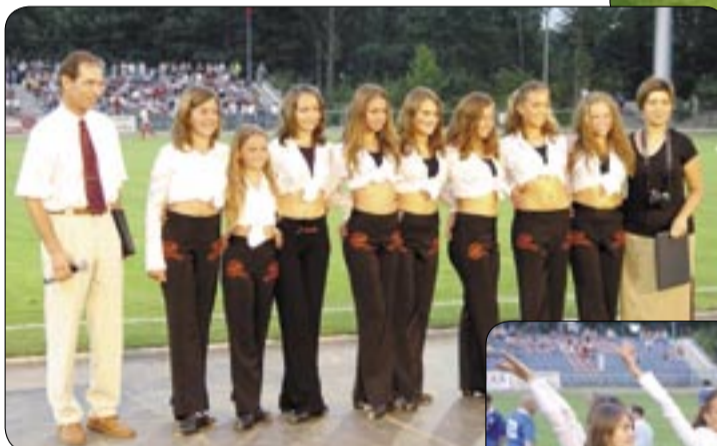
Mistrzyni świata w stepie irlandzkim w akcji - występ Dziecięcego Zespołu Form Tanecznych SALAKE