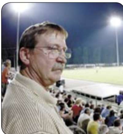
Gość specjalny - Andrzej Szarmach