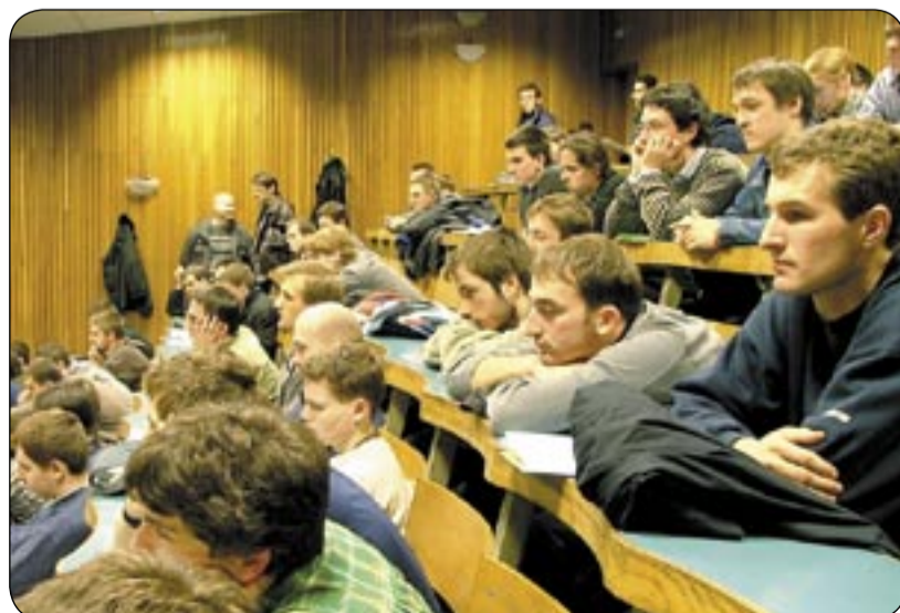
Wrześniowe wykłady powinny zainteresować nie tylko studentów