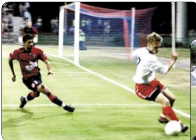
Emocjonujący finisz po zmroku