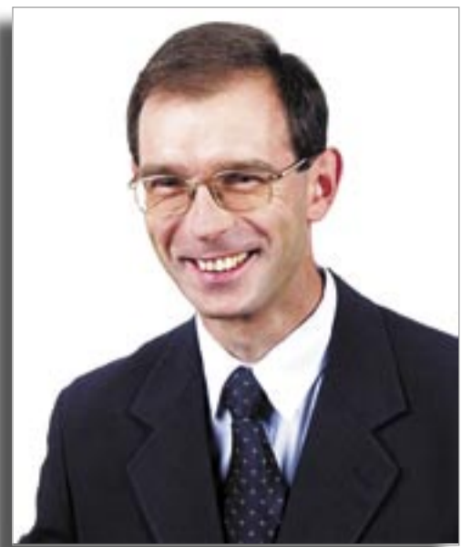
Zygmunt Frankiewicz prezydent miasta:

Kolejna zmiana dotyczy charakteru głosowania. Radni zdecydowali, iż obecnie każde głosowanie jawne będzie głosowaniem imiennym. Możliwość takiej daje wprowadzony od ubiegłego roku elektroniczny system do głosowania. Zmiana tych zapisów przecina dywagacje prawne na temat: można, czy nie można publikować wyników głosowań w internecie? Teraz z pewnością można.