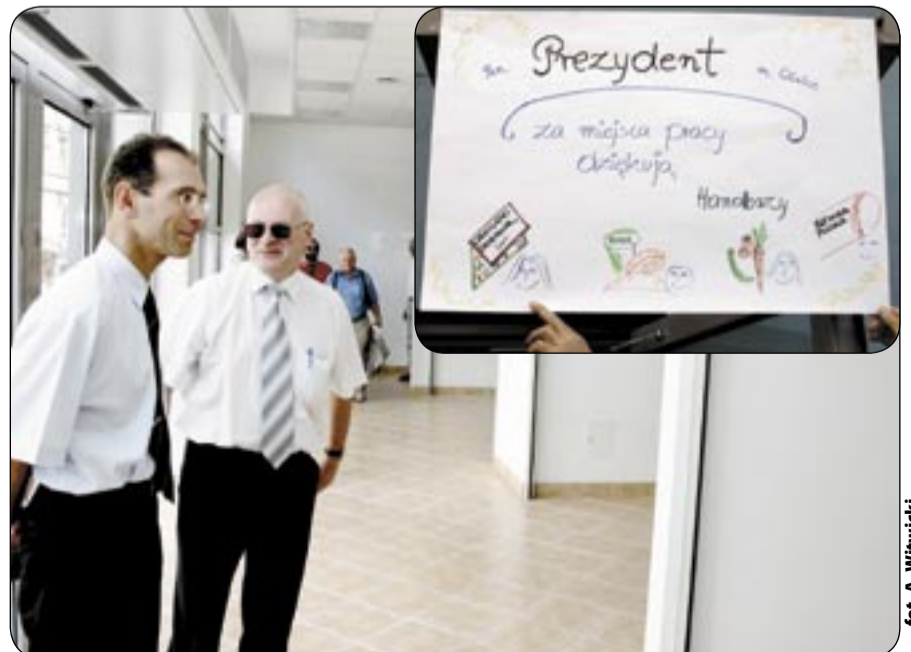
Na parterze budynku (w miejscu dawnych straganów) powstały funkcjonalne pomieszczenia handlowe

Warto podkreślić, że w ostatnich latach na zlecenie ZBM i TBS wzniesiono już 20 budynków mieszkalno - usługowych. Mieszka tam ok. pół tysiąca rodzin. (kik)