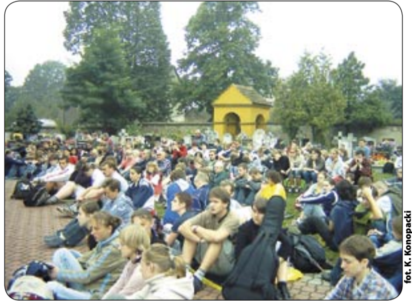
Msza w Tworogu (2005 r.)

Na nowym, zaakceptowanym przez władze komunistyczne herbie, zabrakło miejsca dla Matki Bożej. (...) Dawny herb można dziś podziwiać wyłącznie na frontonie Ratusza bądź na budynkach dawnych szkół miejskich” (np. na elewacji „czerwonej chemii” – dopisek red. ).