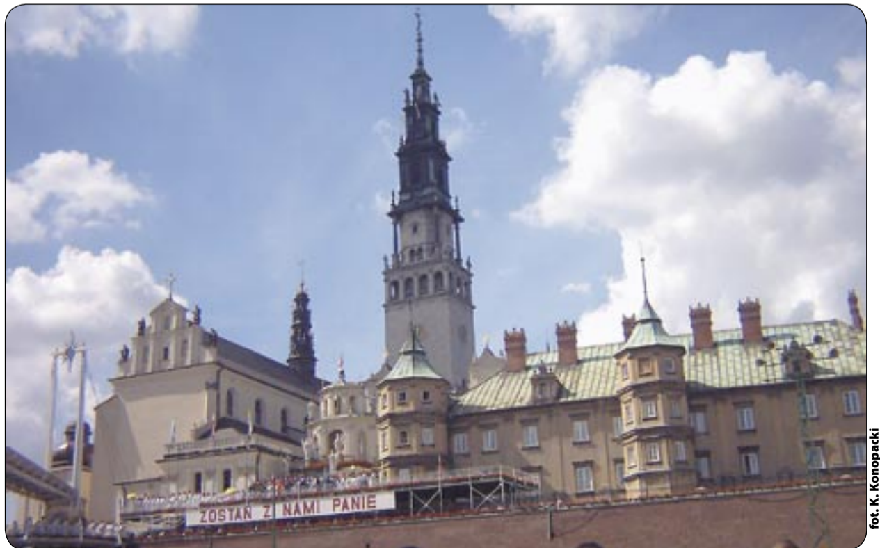
Pod wałami Jasnej Góry

Koronnym dowodem sympatii o.o. paulinów do grodu nad Kłodnicą było umieszczenie jego panoramy na odwrotnej stronie Cudownego Obrazu. Znalazły się tam tzw. Mensa Mariana - malowane dzieje wizerunku Matki Bożej Częstochowskiej. Ich twórcy przedstawili m.in. widoki czterech miast, spośród których połowa (Gliwice i Racibórz) to ośrodki śląskie. Warto podkreślić, że panoramy te malowano w 1680 roku, a więc w czasach, gdy oblężenie Gliwic było już historią, a Jasna Góra pamiętała najazd Szwedów o nieporównanie ważniejszym znaczeniu. Oznacza to, że gliwiczanie musieli utrzymywać z klasztorami bardzo serdeczne kontakty.