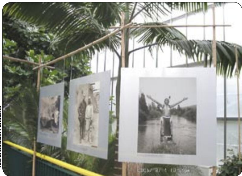
fol. archiwum Palmiarni

Organizatorzy podkreślają, że historia nieprzeciętnych ludzi, ich niezwykłej odwagi, sukcesów i porażek, to dobry przykład dla młodego pokolenia. - Można sobie uświadomić, jak wiele rzeczy zależy od woli człowieka, pasji i chęci pokonywania nieprzekraczalnych granic. Jak ważne jest dążenie do realizacji marzeń i zdobywanie doświadczeń - wyliczają. I choć wydaje się, że Ziemia nie kryje już przed człowiekiem wielu tajemnic, to przeważająca część naszej planety, zwłaszcza schowana pod powierzchnią oceanów, wciąż nie została poznana. Wyzwania czekają więc na kolejne pokolenia śmiałków. (al)