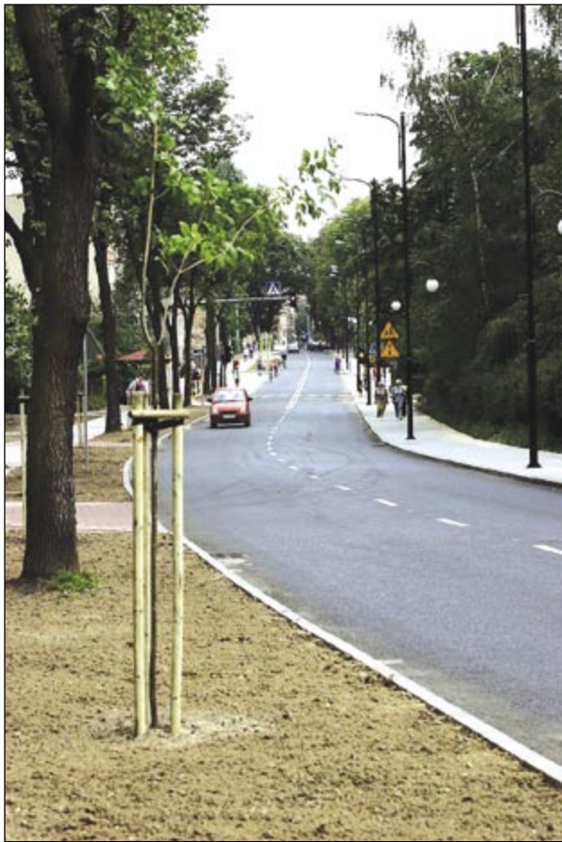
fol. A. Witwicki