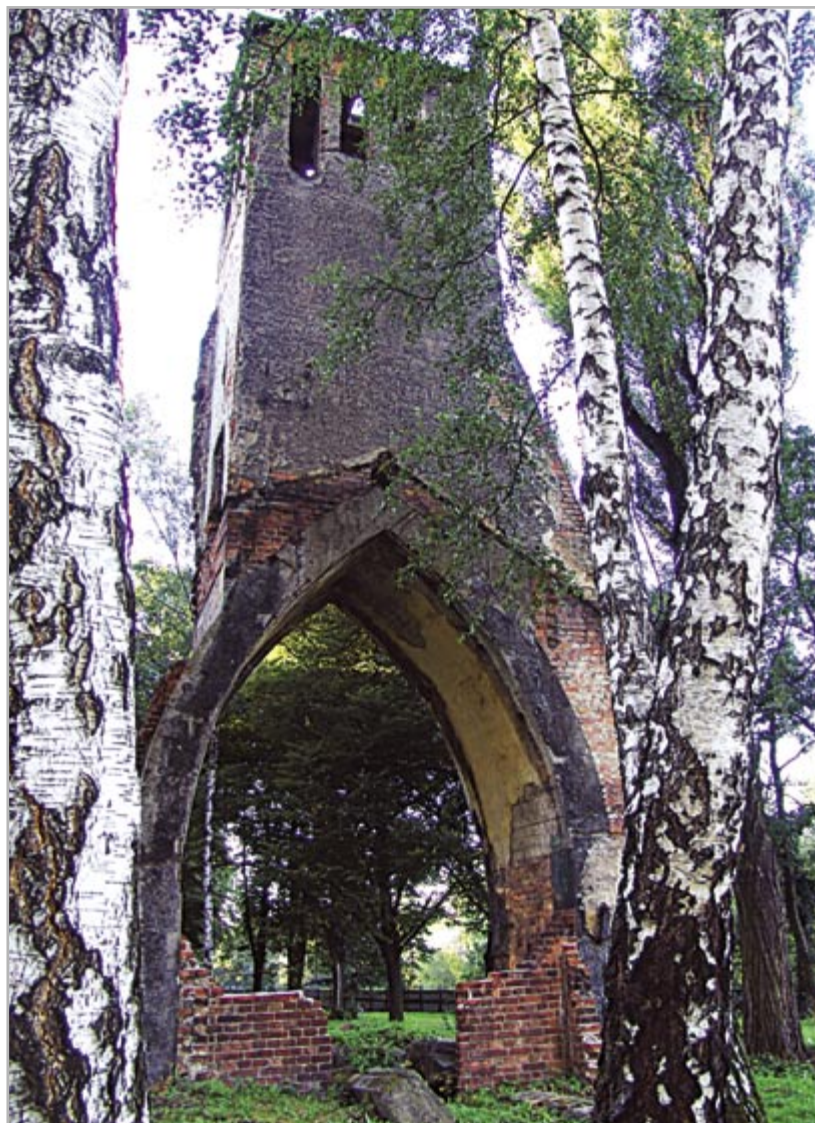
fol. E. Pokorska

W lipcowych i sierpniowych wydaniach MSI pisałam o ciekawych pomnikach w Gliwicach („Piękno zakłete w brzozie”). Wakacje dobiegły końca, wracam więc do swojego stałego cyklu „Śladami historii”.