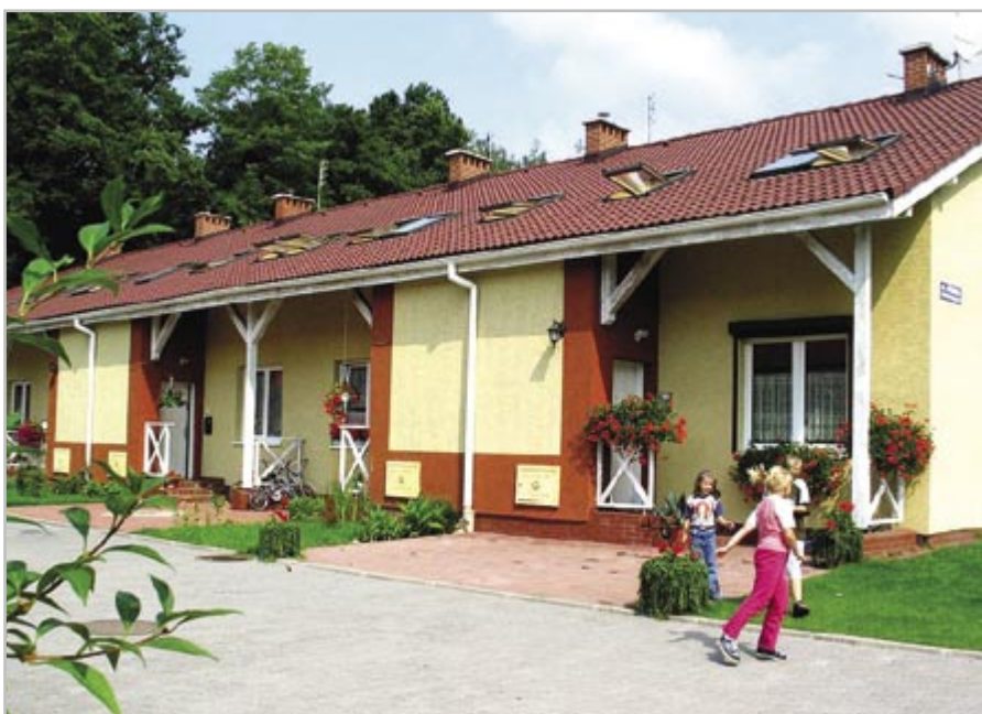
fol. A. Witwicki

Szkolenia są przeznaczone dla mężczyzn o niskich kwalifikacjach - absolwentów szkół podstawowych czy gimnazjów. Aktywizacja zawodowa osób z tej grupy społecznej jest bardzo ważna, bo właśnie dla nich na rynku pracy jest najmniej ofert. W każdym szkoleniu uczestniczy 20 osób, wybranych spośród bezrobotnych, zarejestrowanych w gliwickim Powiatowym Urzędzie Pracy. Zdecydowana większość uzyskuje ostatecznie zaświadczenie o ukończeniu kursu i zdobyciu kwalifikacji. – Kurs ma profil ogólnobudowlany, a właśnie dla budowlanców jest coraz więcej propozycji pracy. Połowa przeszkolonych osób już znalazła zatrudnienie. Pracują jako murarze, kafelkarze, tynkarze lub posadzkarze. Zainteresowanie szkoleniami jest bardzo duże i na pewno będziemy je kontynuować – podkreśla Marek Kuźniewicz, dyrektor Powiatowego Urzędu Pracy w Gliwicach. Kursy są finansowane za pośrednictwem PUP z Funduszu Pracy. Dzięki temu obniża się koszt budowy domów.