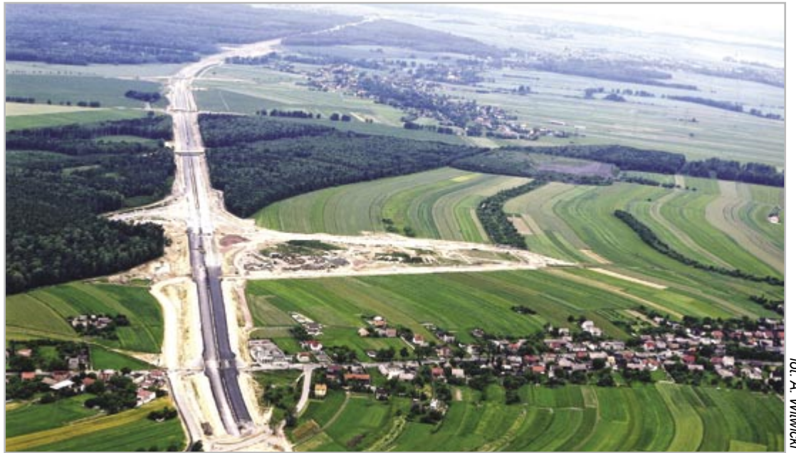
fol. A. Wlirwici

Nie milknie dyskusja wywołana doniesieniami prasowymi na temat możliwości wprowadzenia opłat za przejazd w ruchu lokalnym autostradą A4 w obrębie Gliwic. Społeczny niepokój w tej sprawie jest chyba jednak nieuzasadniony – wynika to z treści listu nadesłanego na ręce przewodniczącego Rady Miejskiej przez sekretarza stanu w Ministerstwie Infrastruktury, a zarazem – pełnomocnika rządu ds. budowy dróg krajowych i autostrad.