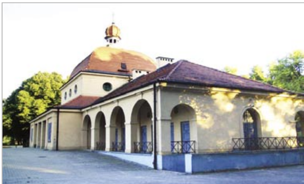
fol. E. Pokorska

Nekropolia u zbiegu ulic Kozielskiej i Czołgowej ma kształt prostokąta. Wzdłuż jego osi przebiegają zdwojone aleje z lipami drobnolistnymi, prowadzące do domu przedpogrzebowego. Wnętrza obiektu kryją następną tajemnicę cmentarza (o innej - reliktach dawnego krematorium - pisałam w poprzednim numerze MSI). Ściany kaplicy, w pasie pod sufitem, pokrywają malowidła ścienne autorstwa Ericha Gottschlicha. Dominującym tematem polichromii jest zaczerpnięty ze średniowiecza motyw korowodu, tańca śmierci – dance macabre. Dziesięć malowideł przedstawia m.in. tańczący szkielet (śmierć) z żołnierzem, górnikiem, mnichem, kobietą i mężczyzną. Makabryczną wizję łagodzi malowidło ze Zmartwychwstaniem Chrystusa, obrazującym nadzieję. Stan techniczny malowideł był, niestety, na tyle zły, że w 1994 roku zostały zabezpieczone i zasłonięte ekranami. Nie wszyscy wiedzą też, jak sądzę, że interesującym uzupełnieniem polichromii była stiukowa boazeria. Warto o tym pamiętać podczas spacerów alejkami Cmentarza Centralnego.