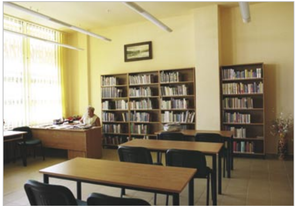
fol. E. Kaliszewska

obłożono płytami kartonowo-gipsowymi. Pomalowano ściany, wymieniono meble. Łączny koszt robót wyniósł ponad 100 tysięcy złotych brutto. W poniedziałek, 5 września, odnowiona filia MBP wznowiła swoją działalność. Placówka zaprasza Czytelników w poniedziałki, środy i piątki w godzinach od 11 do 18, a we wtorki, czwartki i soboty – od 9 do 14. (luz)