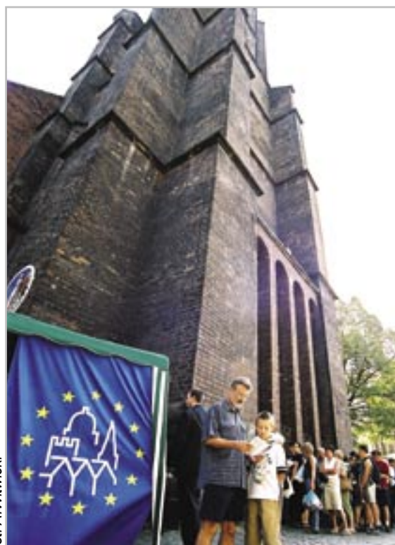
fol. A. Witwicki