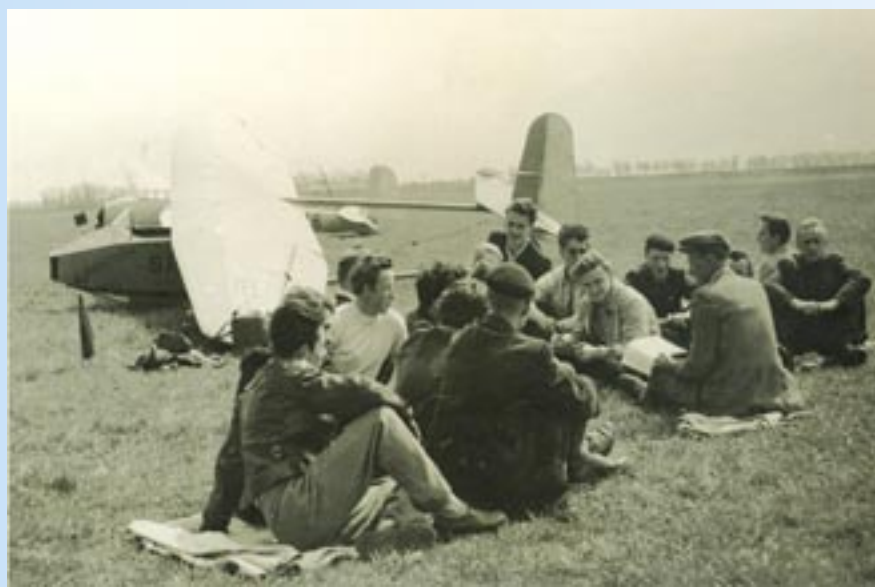
Wypoczywający członkowie aeroklubu

W następnych latach wyremontowano zniszczone podczas wojny hangary, odbudowano budynki portowe i wyrównano płytę lotniska. W 1955 roku utworzono w mieście AEROKLUB GLIWICKI - filię Aeroklubu Śląskiego. Rok później funkcjonował już jako samodzielny ośrodek, obejmujący Ziemię Gliwicką, Bytom, Rudę Śląską, Tarnowskie Góry i Zabrze.