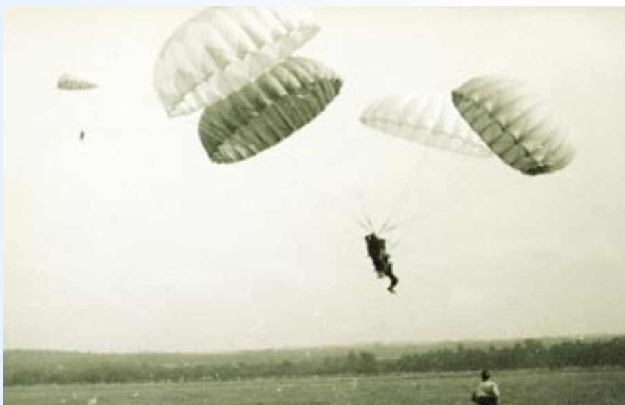
Widowiskowe popisy spadochronowe