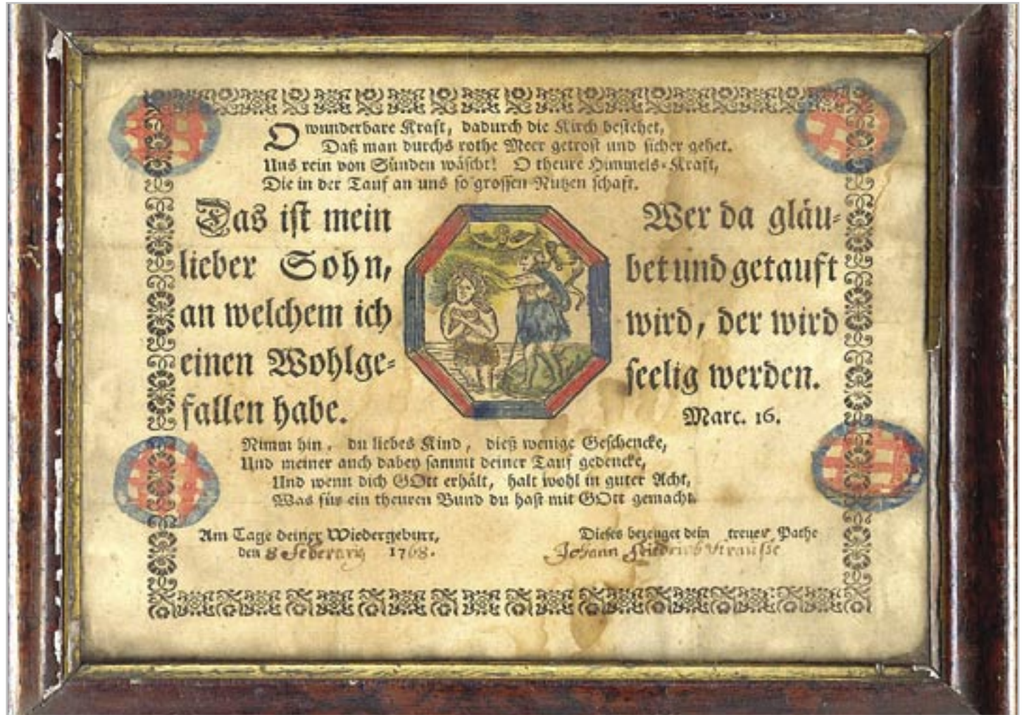
Świadectwo chrztu z 1768 r. – kopia z archiwum Muzeum w Gliwicach

„Święci w Theatrum Sculptorum” oraz „Motywy żeliwne w rzeźbie i plastyce żeliwnej” to tematy ekspozycji organizowanych w Oddziale Odlewnictwa Artystycznego. Kamiennie i drewniane rzeźby będą sąsiadować z żeliwnymi odlewami o tematyce sakralnej. Zobaczymy tam m.in. plakiety - repliki dzieł malarskich (w tym odlew „Ostatniej Wieczery” Leonarda da Vinci).