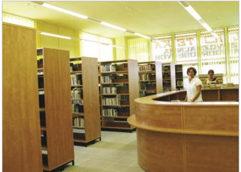
fol. E. Kaliszewska

Dobiegły końca prace remontowe w pomieszczeniach Filii nr 9 Miejskiej Biblioteki Publicznej przy ul. Czwartaków 18 (Osiedle Gwardii Ludowej). Trwały od 21 maja br. Dokonano wymiany podłóg i wewnętrznej instalacji teleinformatycznej, zmodernizowano wnętrza, poprawiono oświetlenie, zamontowano żaluzje w oknach. Przeprowadzono remont sufitów, które