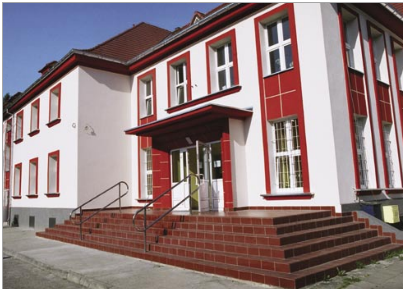
fol. E. Kaliszewska

Próba ustabilizowania, a następnie naprawy finansów ZOZ-ów jest objęcie ich pomocą publiczną oraz tzw. restrukturyzacją. Polega ona na: umorzeniu zobowiązań publicznoprawnych (m.in. wobec Państwowego Funduszu Rehabilitacji Osób Niepełnosprawnych, z tytułu podatków wobec budżetu państwa oraz składek na Fundusz Pracy i na ubezpieczenia społeczne w części finansowanej przez płatnika), rozłożeniu na raty zobowiązań z tytułu składek na ubezpieczenie emerytalne, zdrowotne i społeczne w części finansowanej przez ubezpieczonego, wreszcie – na zawarciu przez zakłady opieki zdrowotnej ugód restrukturyzacyjnych z wierzycielami zobowiązań cywilnoprawnych oraz ugód z pracownikami w zakresie wysuwanych przez nich roszczeń. Umorzeniu będą pod-