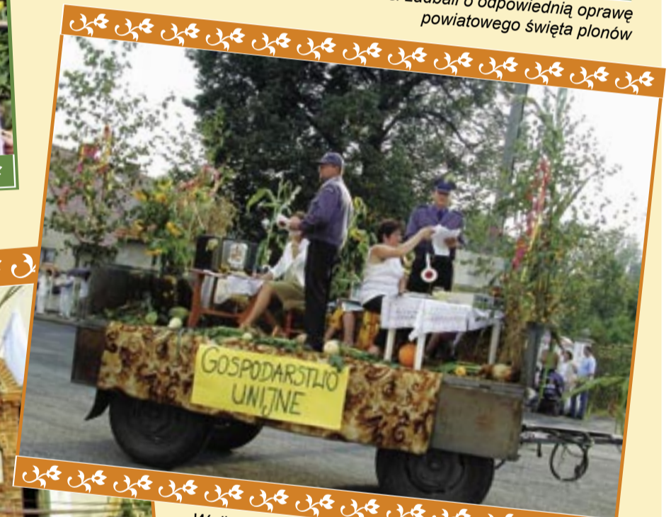
W długim i barwnym korowodzie dożynkowym pojawił się m.in. pojazd świadczący o dużym poczuciu humoru rolników