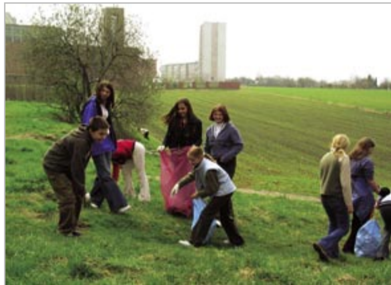
Przez ostatnie lata sprzątno Gliwice w kwietniu