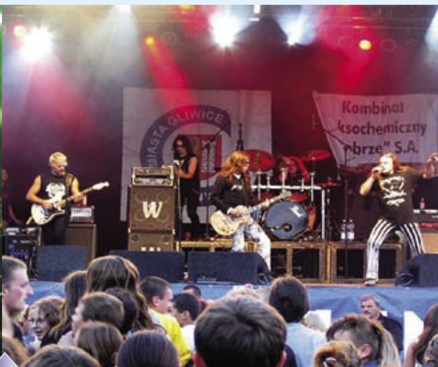
Pod koniec imprezy około 10 tysięcy osób mogło posłuchać występów zespołów POGODNO i ODDZIAŁ ZAMKNIĘTY