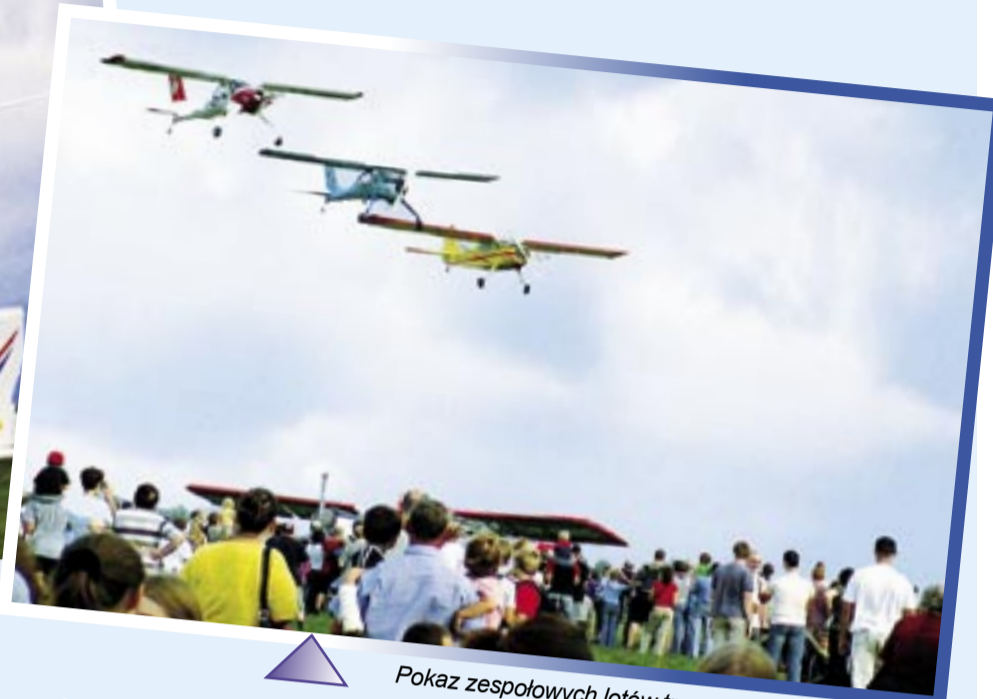
Pokaz zespołowych lotów trzech samolotów 3XTRIM oraz dwóch Wilg i Jaka 12