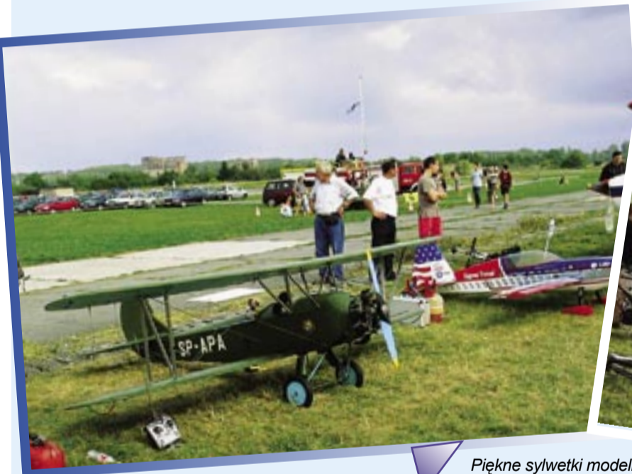
Piękne sylwetki modeli i historycznych samolotów wzbudziły spore zainteresowanie