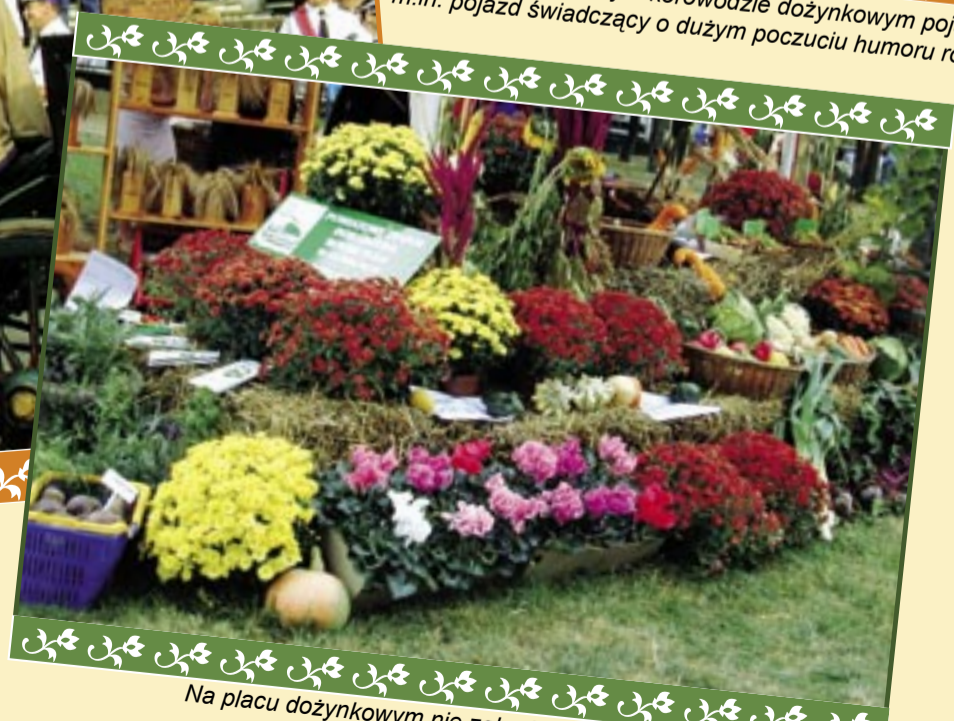
Na placu dożynkowym nie zabrakło stoiska Powiatowego Zespołu Doradztwa Rolniczego z Gliwic