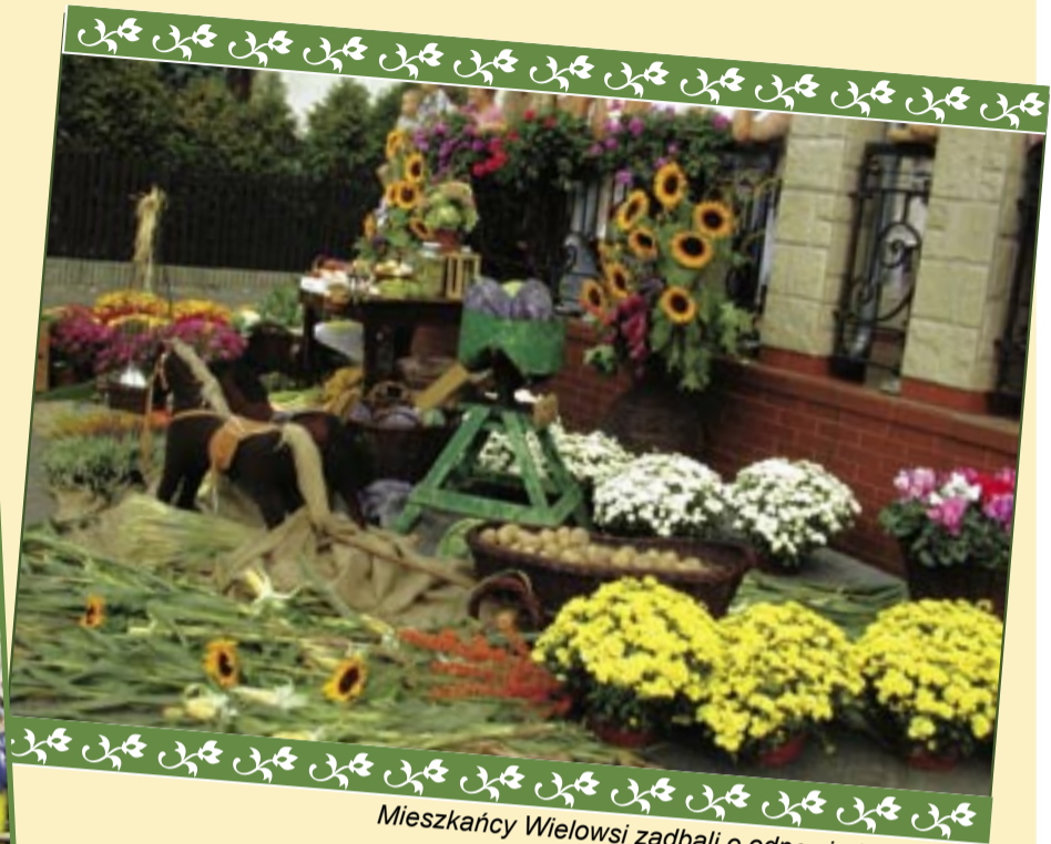
Mieszkańcy Wieloski zadbali o odpowiednią oprawę powiatowego święta plonów