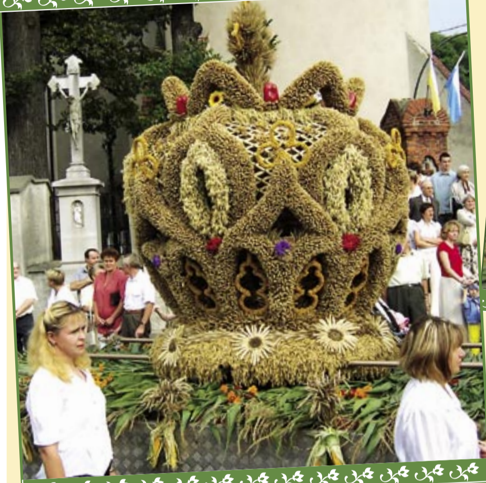
Piękna korona dożynkowa z Dąbrówki