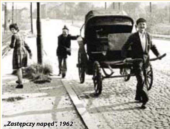
„Zastępczy napęd”, 1962

Prace Rafała Milacha, Stanisława Jakubowskiego czy Ami Vitale to tylko wybrane propozycje zbliżającego się III Gliwickiego Miesiąca Fotografii. Przegląd wystartuje 27 września, potrwa natomiast do 31 października.