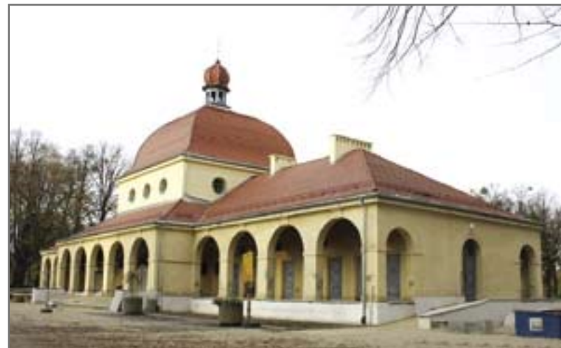
Odnowiony dom przedpogrzebowy na Cmentarzu Centralnym