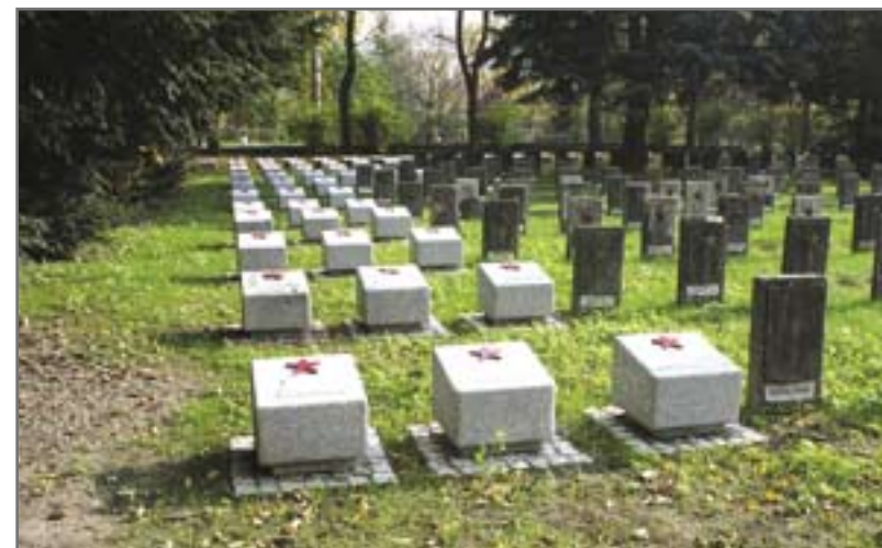
Granitowe płyty nagrobne na Cmentarzu Wojennym Armii Radzieckiej