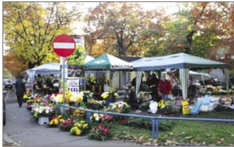
Stoiska handlowe odsunięto od muru cmentarnego przy ul. Poniatowskiego