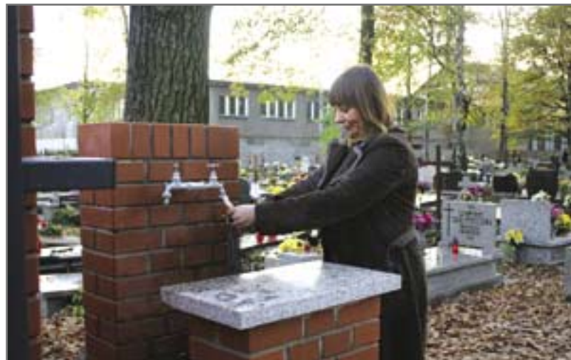
Pojawiły się nowe punkty poboru wody