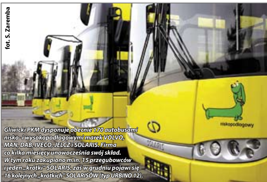
Gliwicki PKM dysponuje obecnie 170 autobusami nisko- i wysokopodłogowymi marek VOLVO, MAN, DAB, IVECO, JELCZ i SOLARIS. Firma co kilka miesięcy unowocześnia swój skład. W tym roku zakupiono m.in. 15 przegubowych i jeden „krótki” SOLARIS, zaś w grudniu pojawi się 16 kolejnych „krótkich” SOLARISÓW (typ URBINO 12).

Gliwic. Podkreśla, że problemy wielokrotnie przejęcie „Tramwajów Śląskich” – firmy skostniałej, bardzo kapitałochłonnej, przez lata niedofinansowanej i zaniedbywanej. Państwowe tramwaje nie tylko obciążały, lecz wręcz zrujnowały cały system KZK GOP. Komunikacyjny Związek Komunalny nie zareagował również na problemy natury obiektywnej, zwłaszcza inflację, która doprowadziła do wzrostu płac i cen paliw. To z kolei podniosło koszty funkcjonowania komunikacji i wysokość stawek przewoźników. – Trzeba jednak zaznaczyć, że nawet droższe niż zwykle przewozy autobusowe – których jest przecież przysłana większość! – dałyby deficyt taki sam, jak funkcjonowanie kilku zaledwie linii tramwajów – argumentuje Z. Frankiewicz.