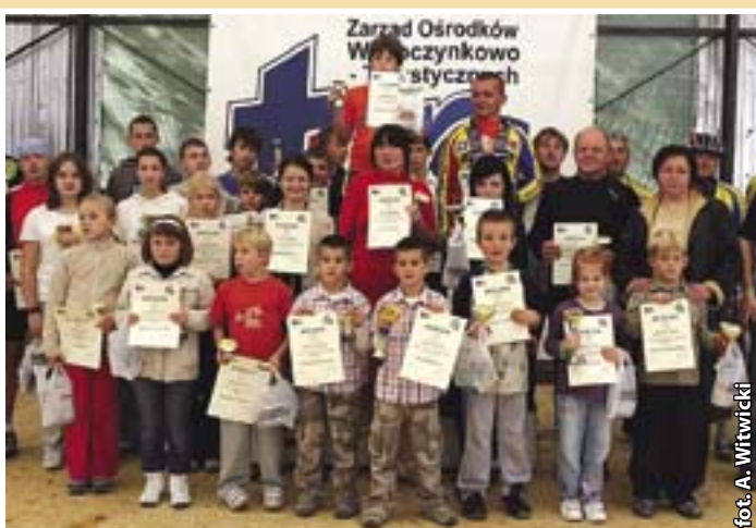
Laureaci dziecięcego konkursu „Już płynam!”

godne dni oblegano dosłownie boiska do siatkówki i piłki nożnej. Dużą popularnością cieszyła się szkoła jazdy konnej. Spore powodzenie miały