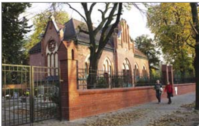
Estetyczne ogrodzenie Cmentarza Lipowego z cegieł klinkierowych

Warto jeszcze dodać, że dojazd do parkingu przy Cmentarzu Lipowym będzie możliwy od strony ul. Horsta Bienka. Na trasie dojazdu zostanie wprowadzony obustronny zakaz zatrzymywania się i postoju – informuje Zarząd Dróg Miejskich. (luz)