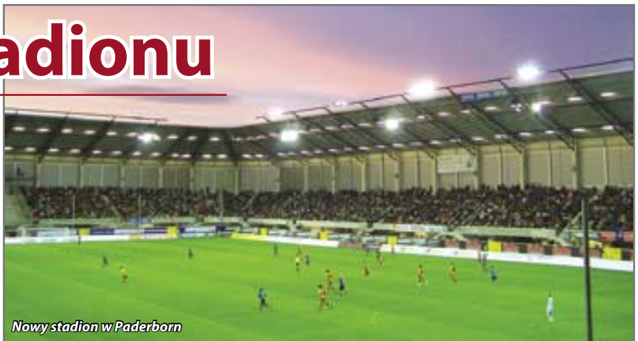
Nowy stadion w Paderborn

„Celem przebudowy i rozbudowy obiektu jest powstanie typowo piłkarskiego stadionu dla rozgrywek ligowych i pucharowych w piłce nożnej, zapewniającego uzyskiwanie odpowiednich licencji PZPN” – czytamy w przetargowej specyfikacji. Zagospodarowanie terenu będzie obejmować nie tylko sam obiekt sportowy i jego infrastrukturę, ale także wewnętrzne drogi dojazdowe, chodniki, zabezpieczenie terenu, miejsca postojowe dla samochodów osobowych i autobusów. W efekcie powstanie projekt stadionu z zadaszonymi trybunami dla 10 tys. widzów (miejsca siedzące) i podgrzewaną murawą płyty głównej (w tym samym miejscu co obecnie).