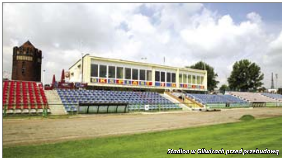
Stadion w Gliwicach przed przebudową