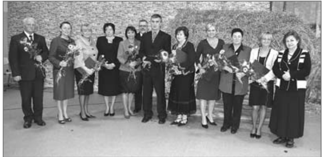
Laureaci prezydenckich nagród I stopnia w dziedzinie oświaty