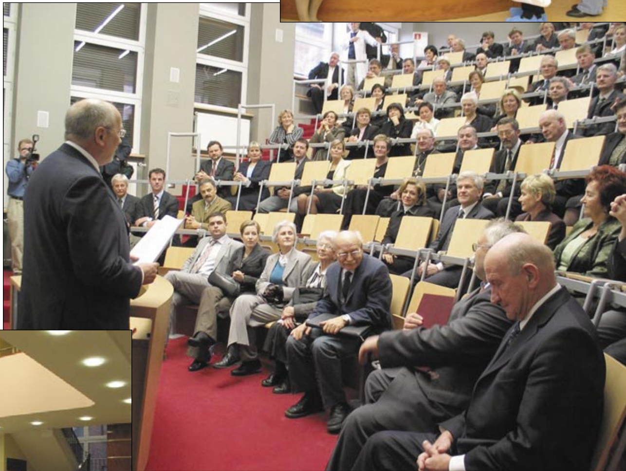
fol. A. Wifwicky