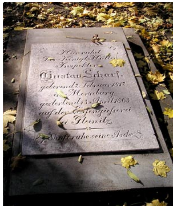
fol. M. Malanowicz

Niezbędne okazało się oczywiście ogrodzenie cmentarza. Stowarzyszenie przygotowało projekt uwzględniający wykorzystanie elementów kamiennych i metalowych,