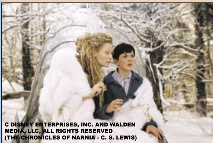
© DISNEY ENTERPRISES, INC. AND WALDEN MEDIA, LLC, ALL RIGHTS RESERVED (THE CHRONICLES OF NARNIA - C. S. LEWIS)

Zajęcia będą prowadzone w okresie od 30 stycznia do 10 lutego, od poniedziałku do piątku, w godzinach od 9.00 do 14.00. Zapisy są przyjmowane w sekretariacie ZSM-E przy ul. Barlickiego (tel. 032-231-47-48 lub 032-231-43-09, e-mail: sekretariat@mail.zsme.gliwice.pl). Tam także można uzyskać szczegółowe informacje o tym przedsięwzięciu. (al)