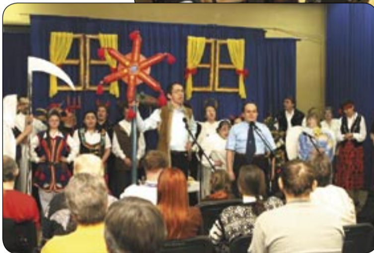
Grali, śpiewali, tańczyli, publiczność klaskała ...