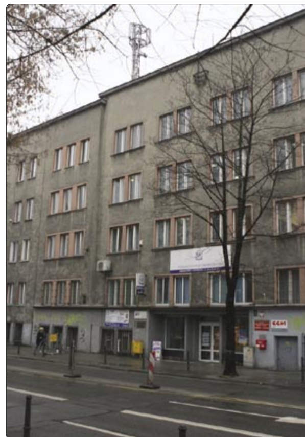
Radio CCM mieści się w budynku, który w przeszłości był siedzibą Komitetu Miejskiego PZPR