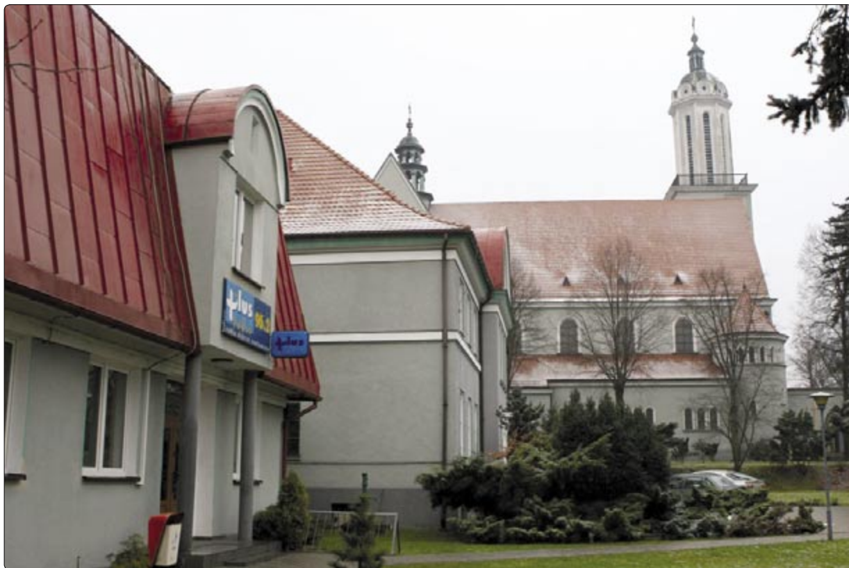
Radio PLUS sąsiaduje z Kościołem pw. św. Antoniego