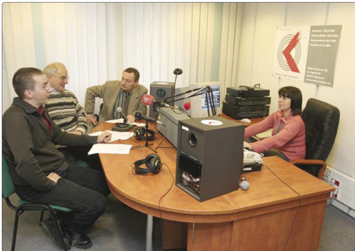
Rozmowy z zaproszonymi gośćmi są stałym elementem programu Radia Katowice

Odmienne charakter ma Radio Katowice - regionalna rozgłośnia radia publicznego. Stacja ma 4 redakcje lokalne działające poza stolicą województwa (Bielsko-Biała, Gliwice, Zawiercie i Częstochowa). Materiały i audycje przygotowane w gliwickiej redakcji wypełniają ok. 10% całego programu rozgłośni. Dociera on do gliwickich słuchaczy za pośrednictwem nadajnika o mocy 10 kW, usytuowanego w Kosztowach (dzielnica Mysłowic). Radio Katowice nadaje też jednak program na innych częstotliwościach. Można go odbierać w Bielsku-Białej (103 MHz - nadajnik na szczycie Skrzycznego), w okręgu raciborsko-wodzisławskim (97 MHz) oraz w Częstochowie (98,4 MHz). Gliwicki oddział radia jest połączony z katowicką centralą za pomocą tzw. sztywnego łącza cyfrowego, co ogromnie ułatwia przesyłanie przygotowanych materiałów. W gliwickiej redakcji pracuje troje dziennikarzy. - Nam jest znacznie trudniej wypromować się na radiowej antenie, niż stacjom kojarzonym tylko i wyłącznie z Gliwicami. Musimy