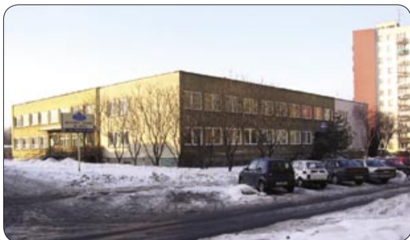
Przychodnia „Medicor” (ul. Zubrzyckiego)