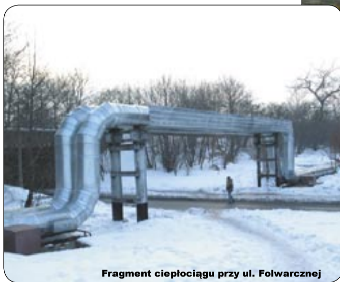
Fragment ciepłociągu przy ul. Folwarcznej