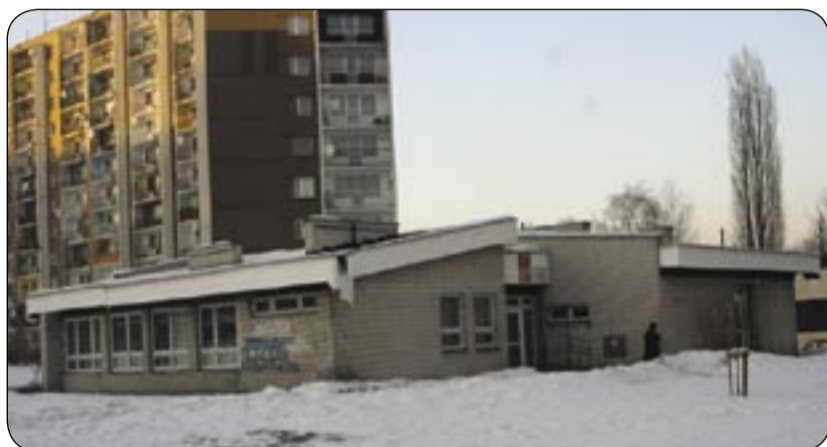
Przychodnia „San-Med” (ul. Kozielska)