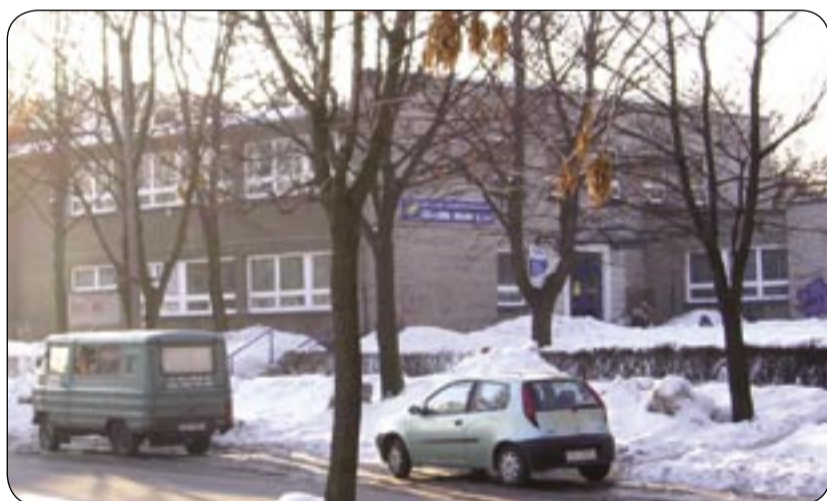
Przychodnia „Sikornik” (ul. Rybitwy)

Najpierw był w Gliwicach jeden duży ZOZ. Niesprawnie organizacyjnie moloch, który nie zdał egzaminu w nowych warunkach. Zlikwidowano go więc, a na jego miejsce utworzono pięć podmiotów.