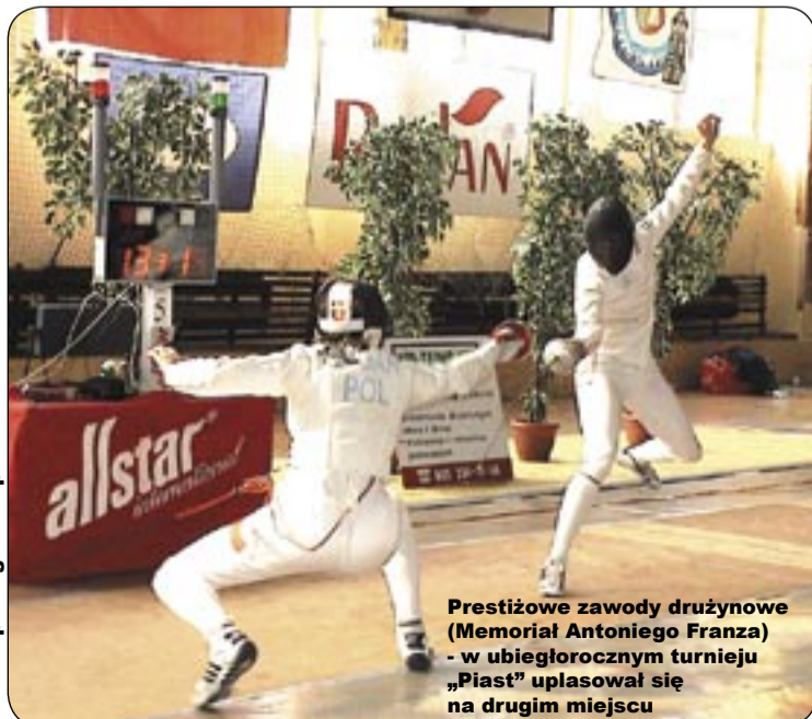
Prestiżowe zawody drużynowe (Memoriał Antoniego Franza) - w ubiegłorocznym turnieju „Piast” uplasował się na drugim miejscu

Będą w nich uczestniczyć nie tylko sportowcy z naszego kraju, ale także z Austrii, Białorusi, Czech, Litwy, Rumunii, Słowacji i Ukrainy. Turniej zostanie rozegrany w hali sportowej Zespołu Szkół Łączności przy ul. Warszawskiej 35 w Gliwicach od 17 do 19 lutego. W piątek od godz. 11.00 będą rywalizować kobiety, a w sobotę - mężczyźni. W niedzielę o godz. 10.00