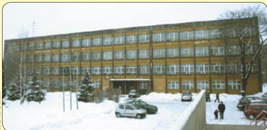
Zespół Szkół Ekonomiczno-Technicznych w Sośnicy