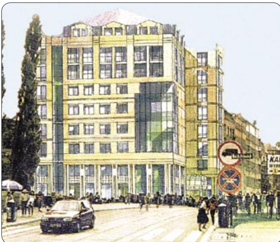
Architektoniczna koncepcja z 1998 roku