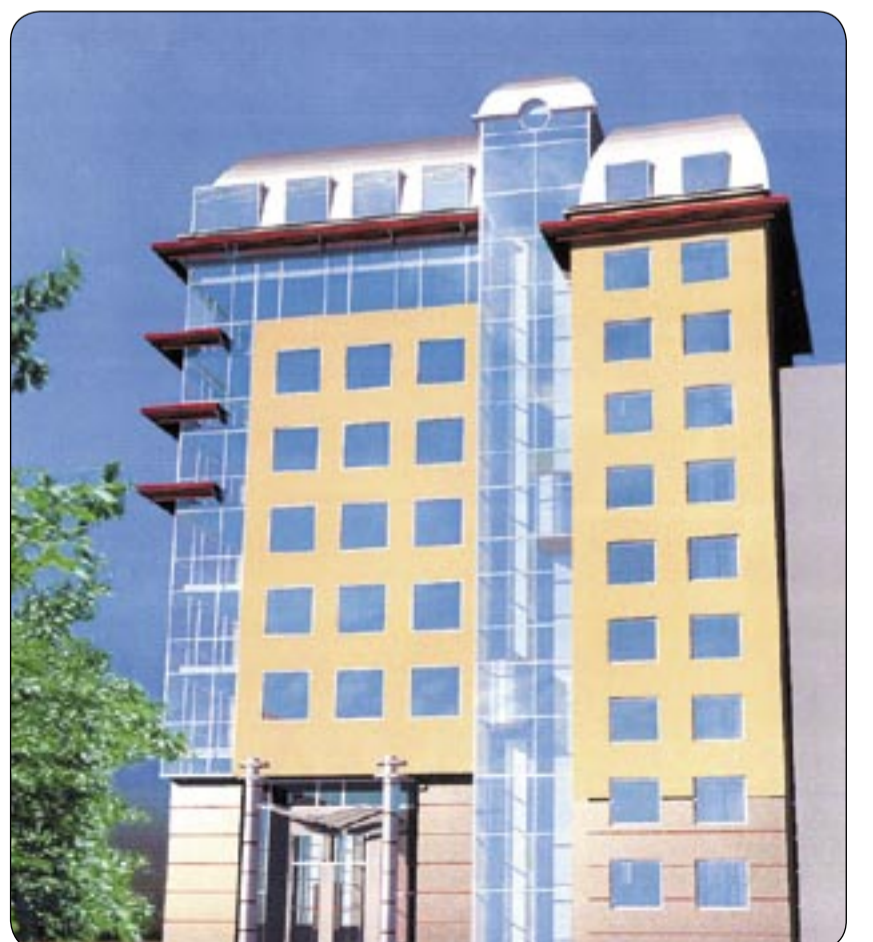
Niezrealizowany projekt z 2002 roku