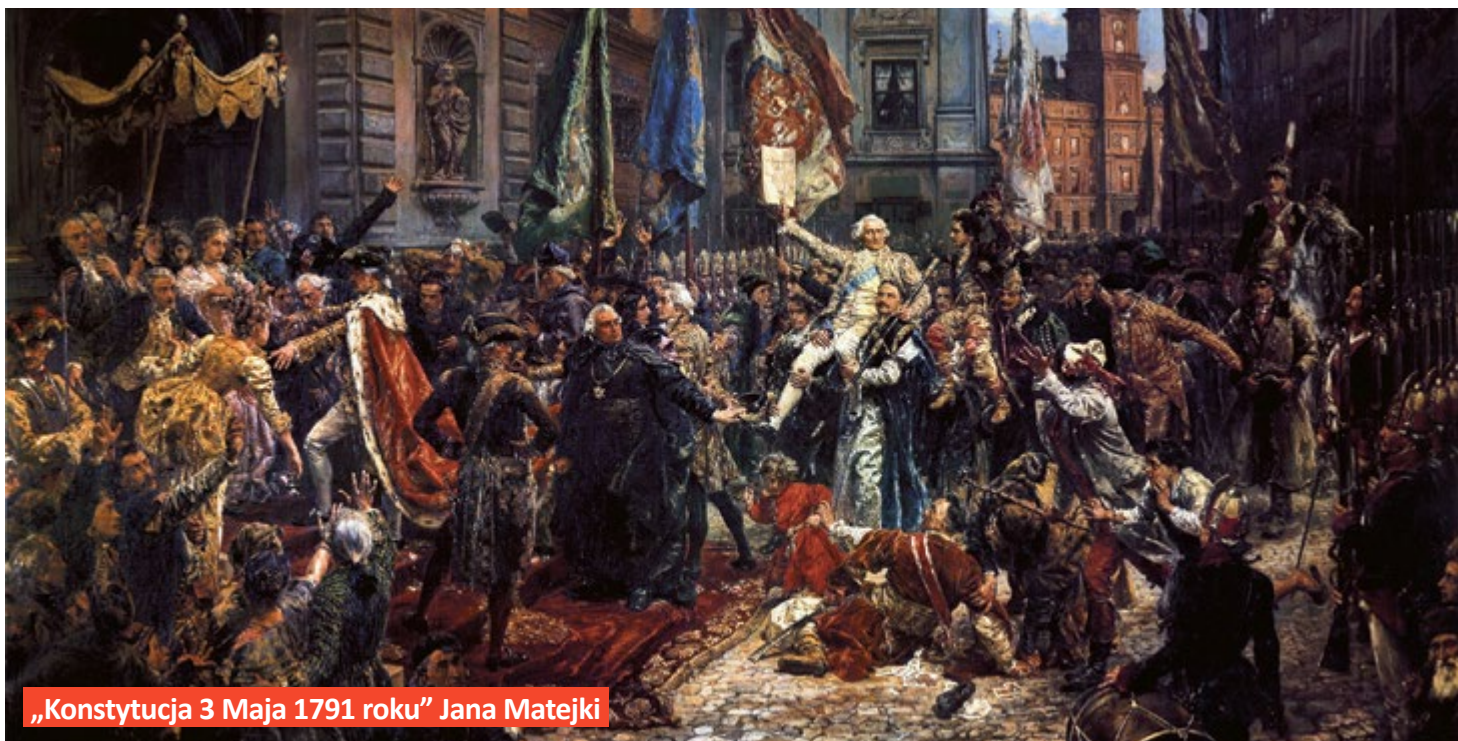
„Konstytucja 3 Maja 1791 roku” Jana Matejki

Choć Konstytucja 3 maja liczyła tylko jedenaście artykułów (dla porównania – Konstytucja RP z 2 kwietnia 1997 roku ma 243 artykuły), stała się mitem dla żyjących pod zaborami. Miała być początkiem zmian w Rzeczypospolitej, jednak z punktu widzenia ówczesnej sytuacji międzynarodowej została przyjęta zbyt późno. Dla współczesnych Polaków rocznica jej uchwalenia jest jednym z najważniejszych świąt państwowych, pamiątką historycznej przeszłości.