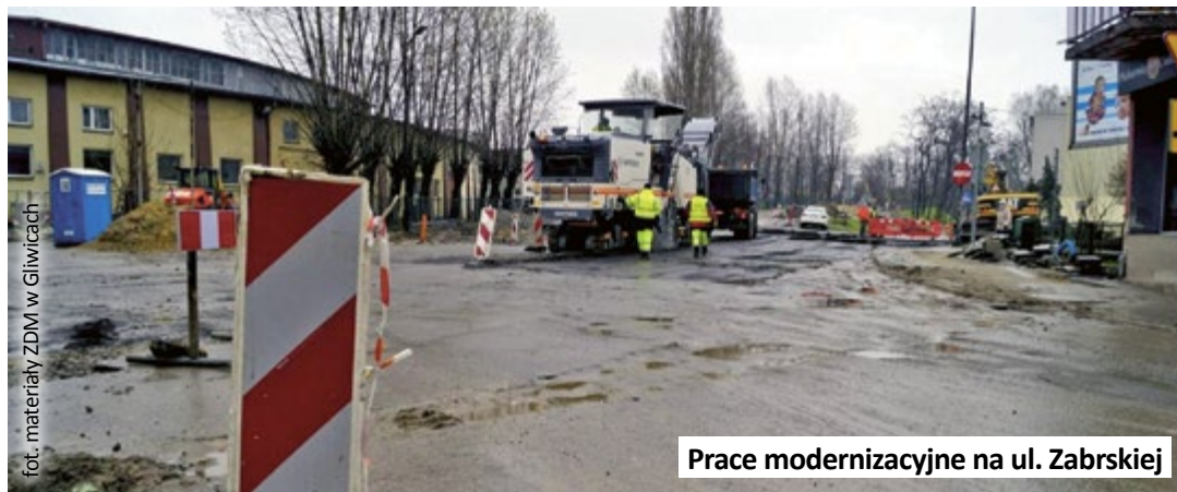
Prace modernizacyjne na ul. Zaburskiej

Na czas robót wprowadzono też dodatkowe zmiany w organizacji ruchu na ulicach przyległych do remontowanego odcinka: na ul.