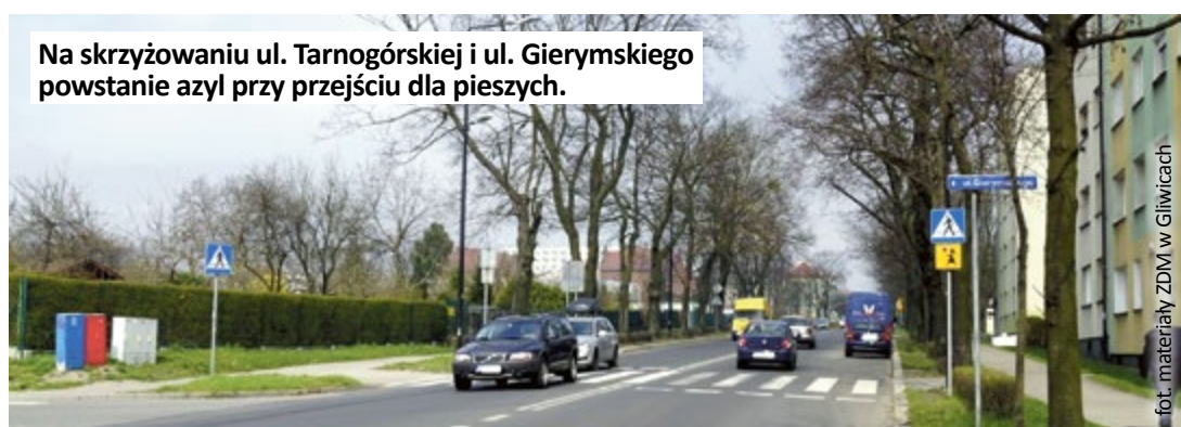
Na skrzyżowaniu ul. Tarnogórskiej i ul. Gierymskiego powstanie azyl przy przejściu dla pieszych.

Z powodu remontu kanalizacji deszczowej od 4 maja do końca miesiąca zamknięty dla ruchu będzie fragment ul. Wybrzeże Armii Krajowej , na odcinku między Instytutem Onkologii a wyjazdem do ul. Jana Śliwki. Objazd prowadził będzie ul. Marii Konopnickiej do ul. Henryka Sienkiewicza, dalej do ronda im. Stanisława Byliny, przez DTŚ z wyjazdem do ul. Jana Śliwki. (mf)