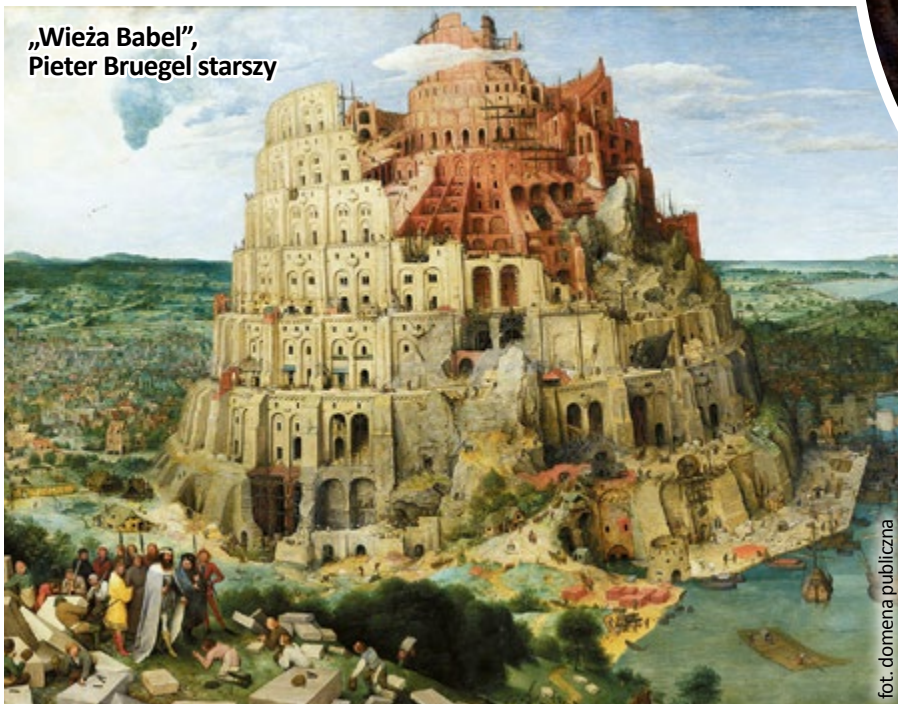
„Wieża Babel”, Pieter Bruegel starszy

Gdy powstawało esperanto, językiem międzynarodowym był francuski. Zamenhof chciał jednak, aby język jego pomysłu był łatwiejszy do nauki.