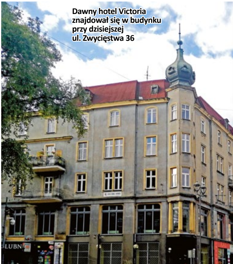
Dawny hotel Victoria znajdował się w budynku przy dzisiejszej ul. Zwycięstwa 36

Zaczęły powstawać pierwsze stowarzyszenia nauki „języka nadziei” i tak w naszych Gliwicach grupa