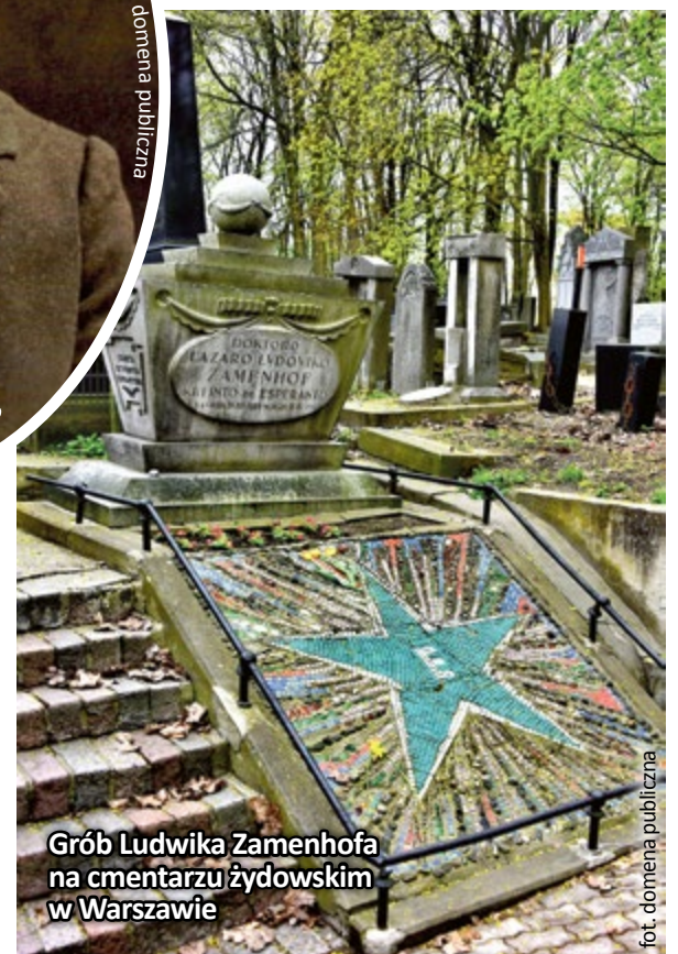
Grób Ludwika Zamenhafa na cmentarzu żydowskim w Warszawie