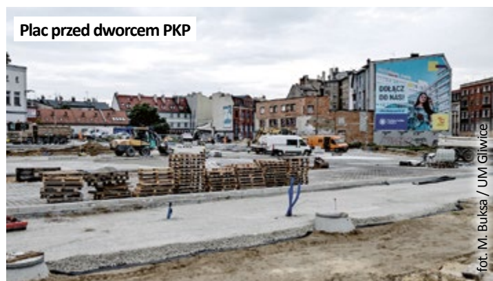
Plac przed dworcem PKP